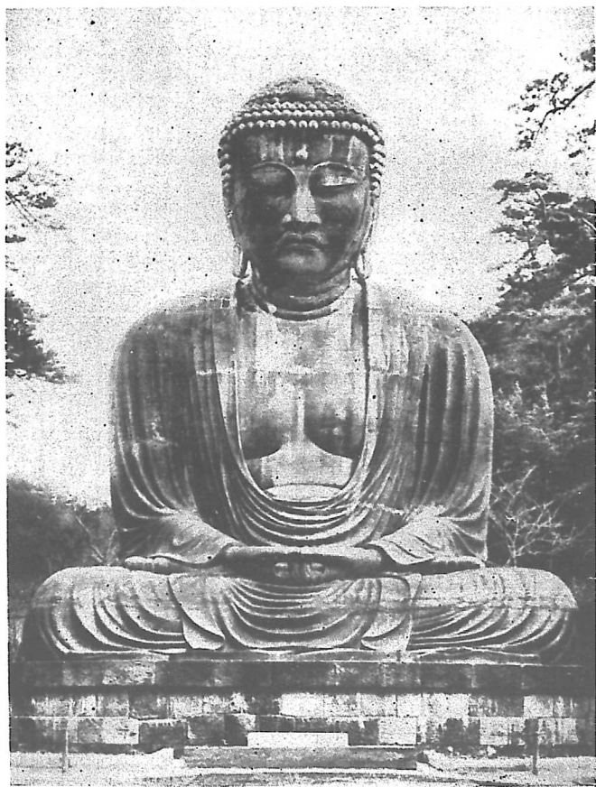
(像佛陀彌阿) 佛大倉鎌