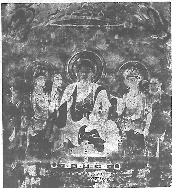
聖德太子創建法隆寺及法隆寺壁畫