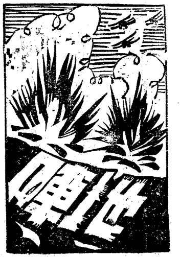
第一八三期 歡迎投稿