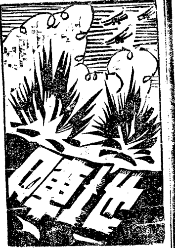
期六七一第 (稿投迎歡)