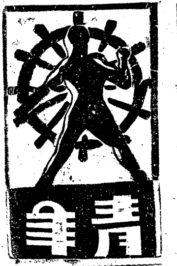
第十期 青年團社刊週年青年團