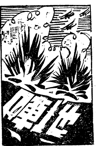
期二八一第 (稿投迎歡)