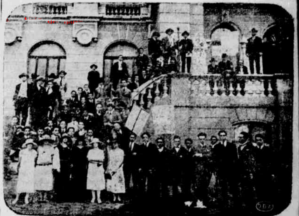
Os veteranos corajosamente no "jardim zoologico", em companhia de "bichos".

Os "bichos" da Universidade receberam ante-hontem um baptismo que foi um verdadeiro negocio de pa'ra filho.