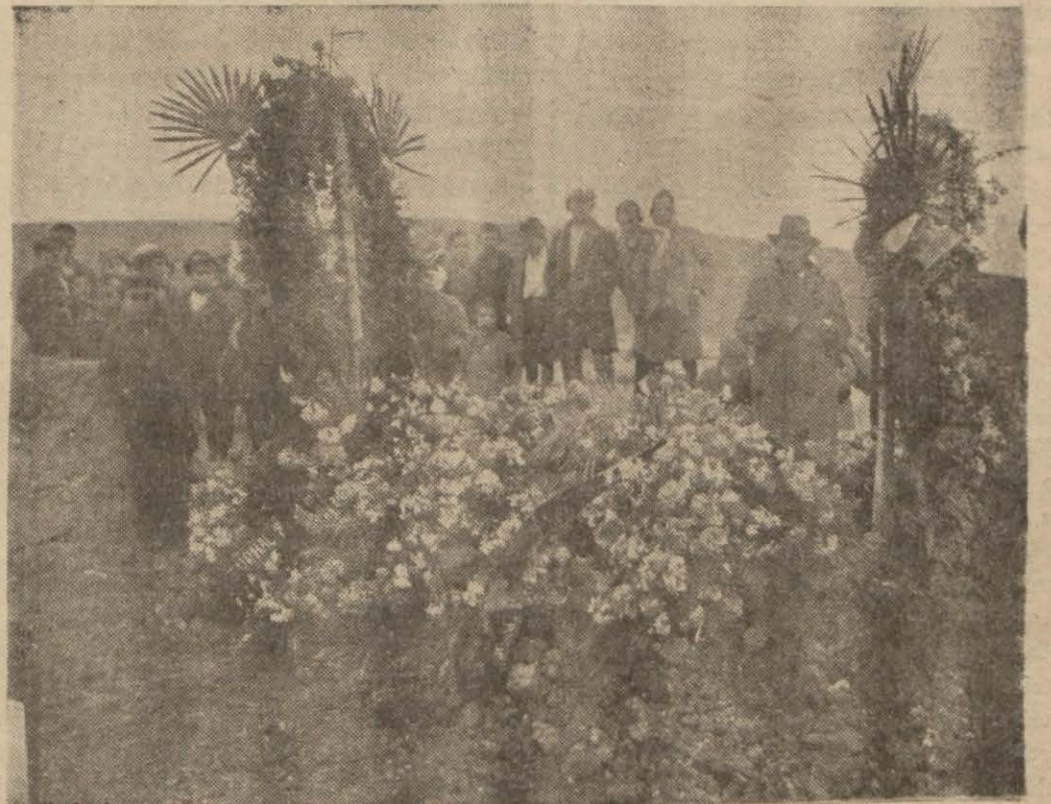
Emin Fikri Özalp toprağına verildikten sonra çelenklerle dolu mezarı