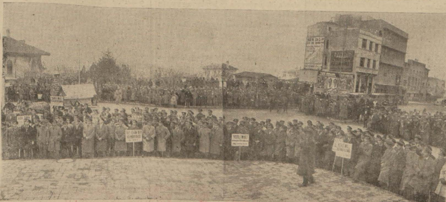
Artırma ve yerli malı kullanmak için dün yapılan and toplantısı