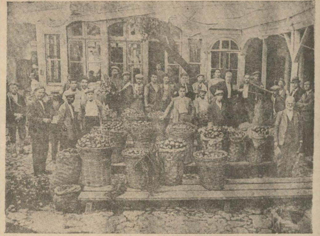
İzmir sebze ve meyve satış kooperatifi merkezî iş başında

Kredi ve satış kooperatiflerinin ayrı ayrı olmaları halinde - azanın büyük bir