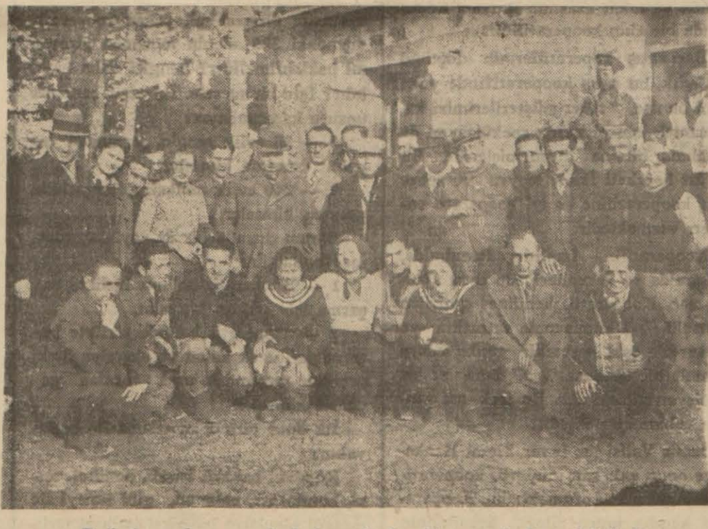
Dağcıların bayramında bulunanlardan bir grup imdat evi önünde

Halkevi kurslar kolu daktilo kursu açmıştır. Derslere bu yedi günde başlanacaktır.