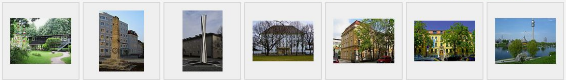
Wohnsiedlung Maßmannplatz Obelisk im Dreieck Winzererstraße/Lothstraße/Georgenstraße Stele diagonal (1986) von Ben Muthofer Stadtarchiv München Mannschaftsgebäude Kasernengebäude, ehemaliger Teil der Prinz-Leopold-Kaserne in der Winzererstraße 43 Olympiapark

An der Winzererstraße 9 liegt das Bayerische Staatsministerium für Arbeit und Soziales, Familie und Integration, an der Winzererstraße 45 liegt die Holzforschung München (TU München), an der Winzererstraße 47a liegt die Abteilung Erhebung des Finanzamt Münchens, an der Winzererstraße 68 liegt das Stadtarchiv, an der Winzererstraße 106 das Landesarbeitsgericht und das Arbeitsgericht München.