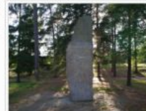
Det här är Minnesstenen i Margaretaparken