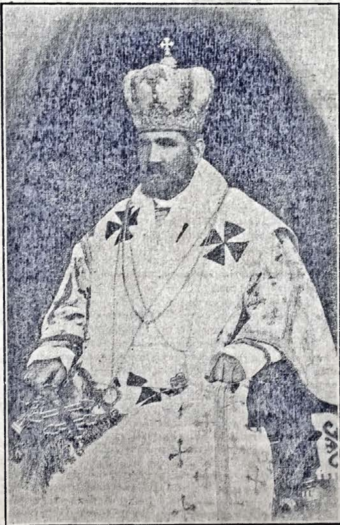
МИТРОПОЛИТ АНДРЕЙ ШЕПТИЦЬКИЙ. (В часі паломництва до Св. Землі.)

Відтак відсв'ячено ще суплікацію і Митрополит, поблагословивши всіх