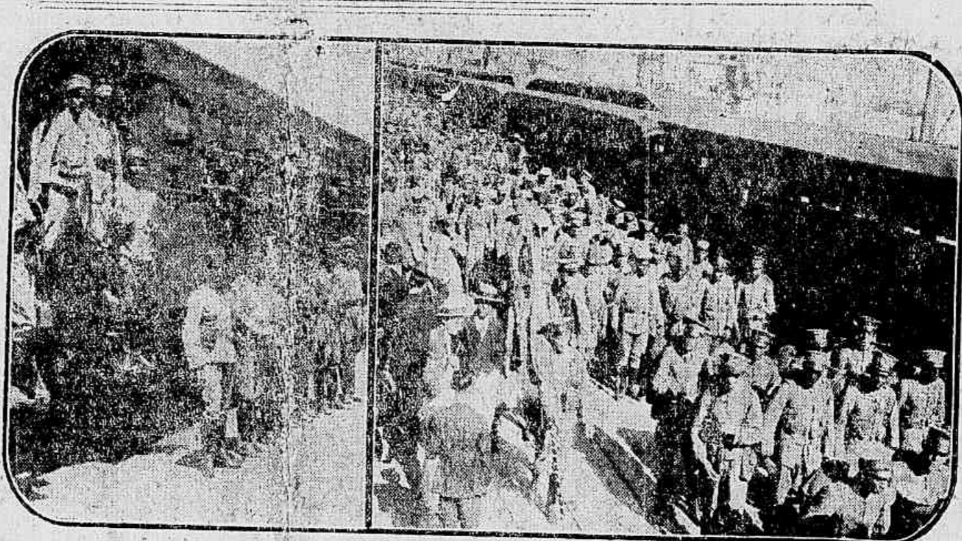
Os sargentos da 1ª bateria do 5º grupo de artilharia de montanha, junto aos vagões conduzindo os praças dessa unidade do Exército, as quaes ali esperam a hora de embarcar no "Rio de Janeiro", e aspecto de marcha para aquelle navio, também do 12º regimento, com sede na capital mineira