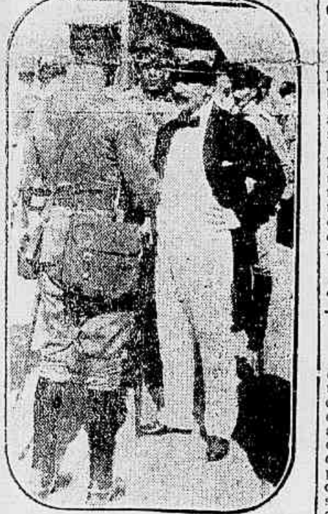
O Sr. ministro da Guerra, Dr. Pandiá Calogeras, dando ordens ao major Hippolyto de Medeiros, no caes do porto, momentos antes de desembarcar do trem que chegou de Minas e 1º batalhão do 12º regimento, do commando daquella unidade - official

Não se recusa de esplendor épico, nem de notas vibrantes de entusiasmo, o embarque das tropas que vão completar a columna do Exército mobilizada contra os sertões bahianos.