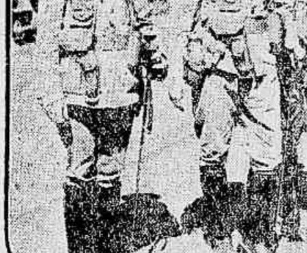
Officinas do 1º batalhão do 12º regimento, de Belo Horizonte

Um official de reconhecido merito e relativo prestigio entre os seus camaradas, conversando, a bordo do "Rio de Janeiro", com o representante da A NOITE, emittiu as seguintes opiniões: