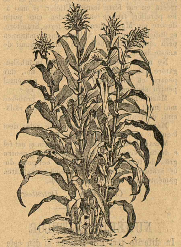
Porumb alb sbărcit „Dinte de cal“ [a se vedea explicația în articolul Exponițiunea din R.-Sarat din acest număr].

Măzăricea de primăvară, infăcișată de a doua gravură din acest număr, e varietatea primăvaratecă a Măzăriceii de toamnă ( Vicia sativa ). E Măzăricea cea mai răspândită, nu poate suferi frigul de érnă din România. Se sémănă de obicinuit amestecată cu orz și ovés pentru a o susține. Bobul cântăresce 80 kilogr. la hectolitrul și se sémănă tot atâta séménță ca Măzăricea părósă, adică 200 kilograme la hectar. Se înțelege că dacă se sémănă amestecată cu o cereală se pune mai puțin. În acest cas se sémănă 150