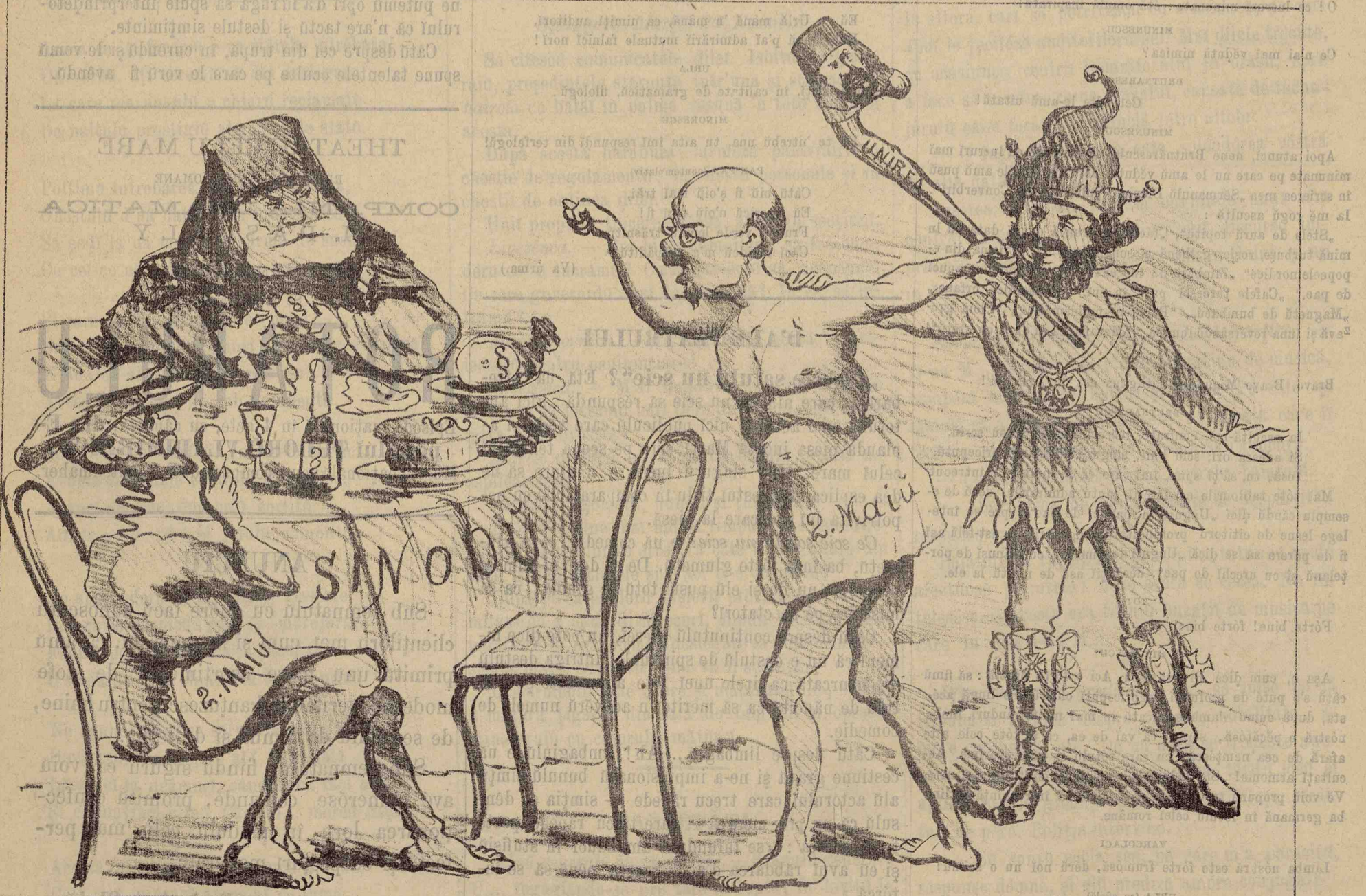
URANGUTANULU'. — Băgați de seaaamă! Destulû de cându' vë imbuibați cu ciolaneleși paragrafele bugetulu', pe cându' pe mine m'a uitatû tótă lumea, de și amû făcutu' pe 2 MAIU, amû consolidatû UNIREA prin BATE' la 1869 și amû agitatû indestulû estimpû SCANDALULU' mitropoliițorû!