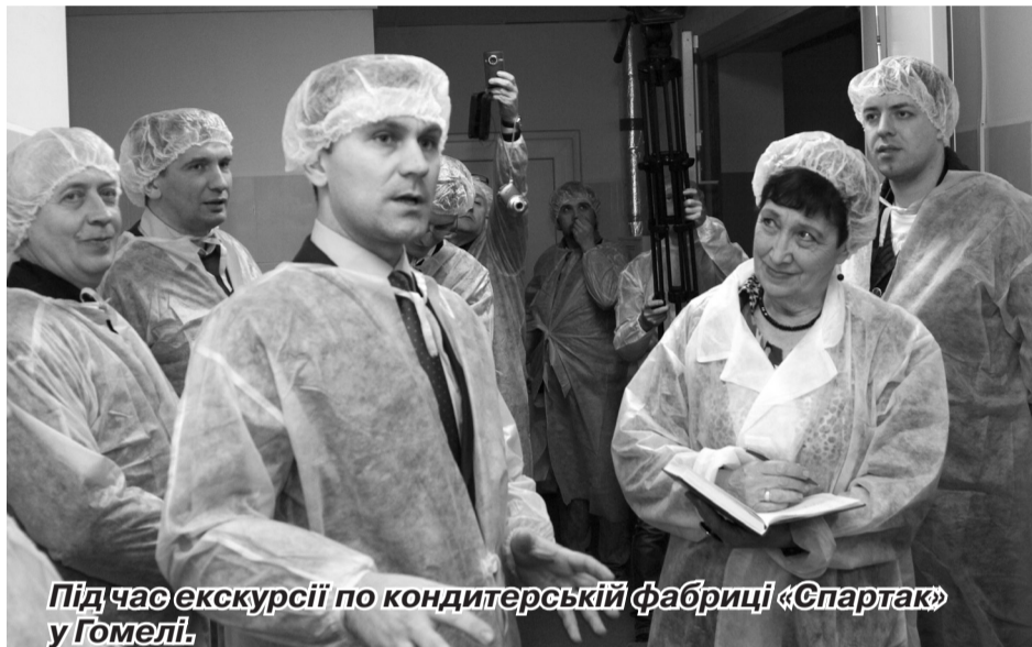
Під час екскурсії по кондитерській фабриці «Спартак» у Гомелі.

р., – але збільшився. І найбільший внесок у це зробили торгівля та сільське господарство.