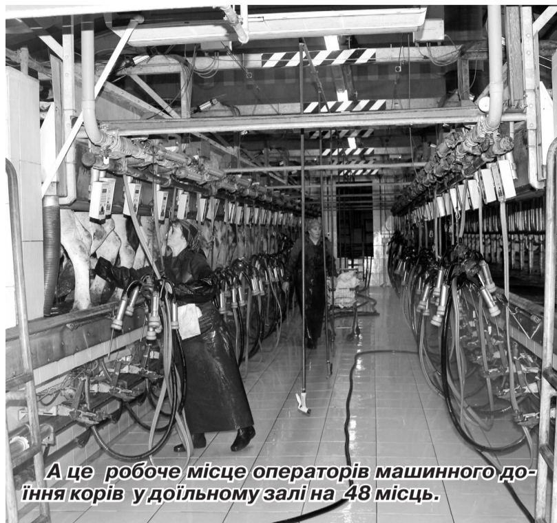
А це робоче місце операторів машинного доіння корів удоїльному залі на 48 місць.

кого Князівства Литовського, аби їх прах розчинився безслідно у білоруській землі? Чи не та ж причина – бажання, аби тебе пам'ятали й шанували? Навіть після твоєї смерті... Виходить, це теж моральний – хоч і післяжиттєвий стимул?..