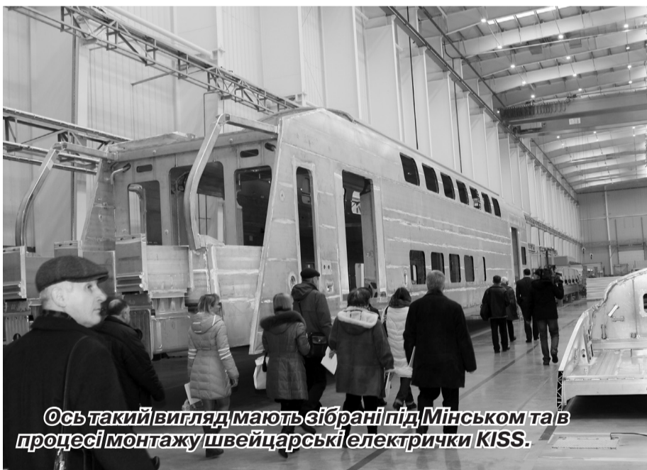
Ось такий вигляд мають зібрані під Мінськом тав процесі монтажу швейцарські електрички KISS.

Та навіть взяті інші виховний аспект – форми і методи морального стимулювання.