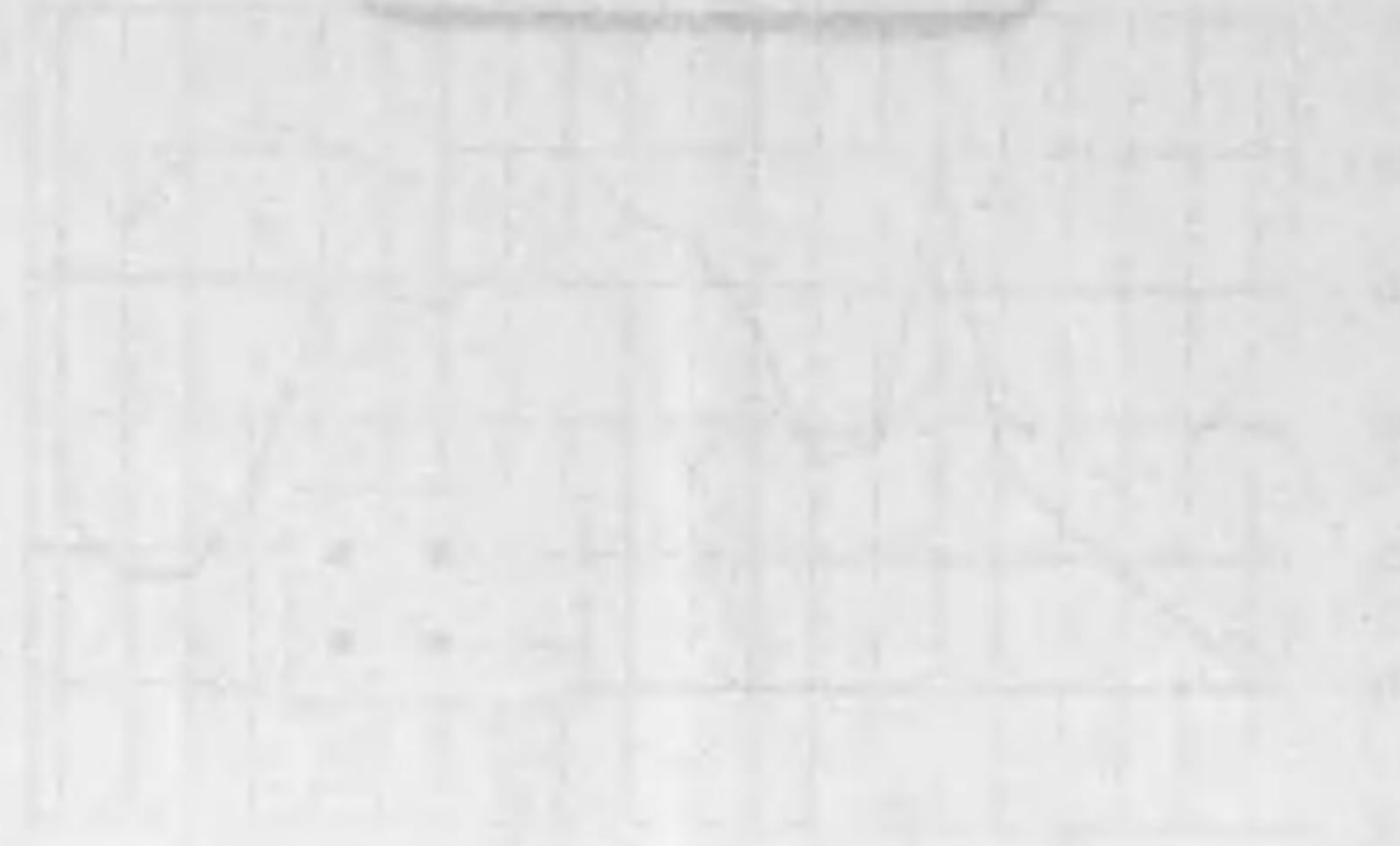
Faint text below the first graph.