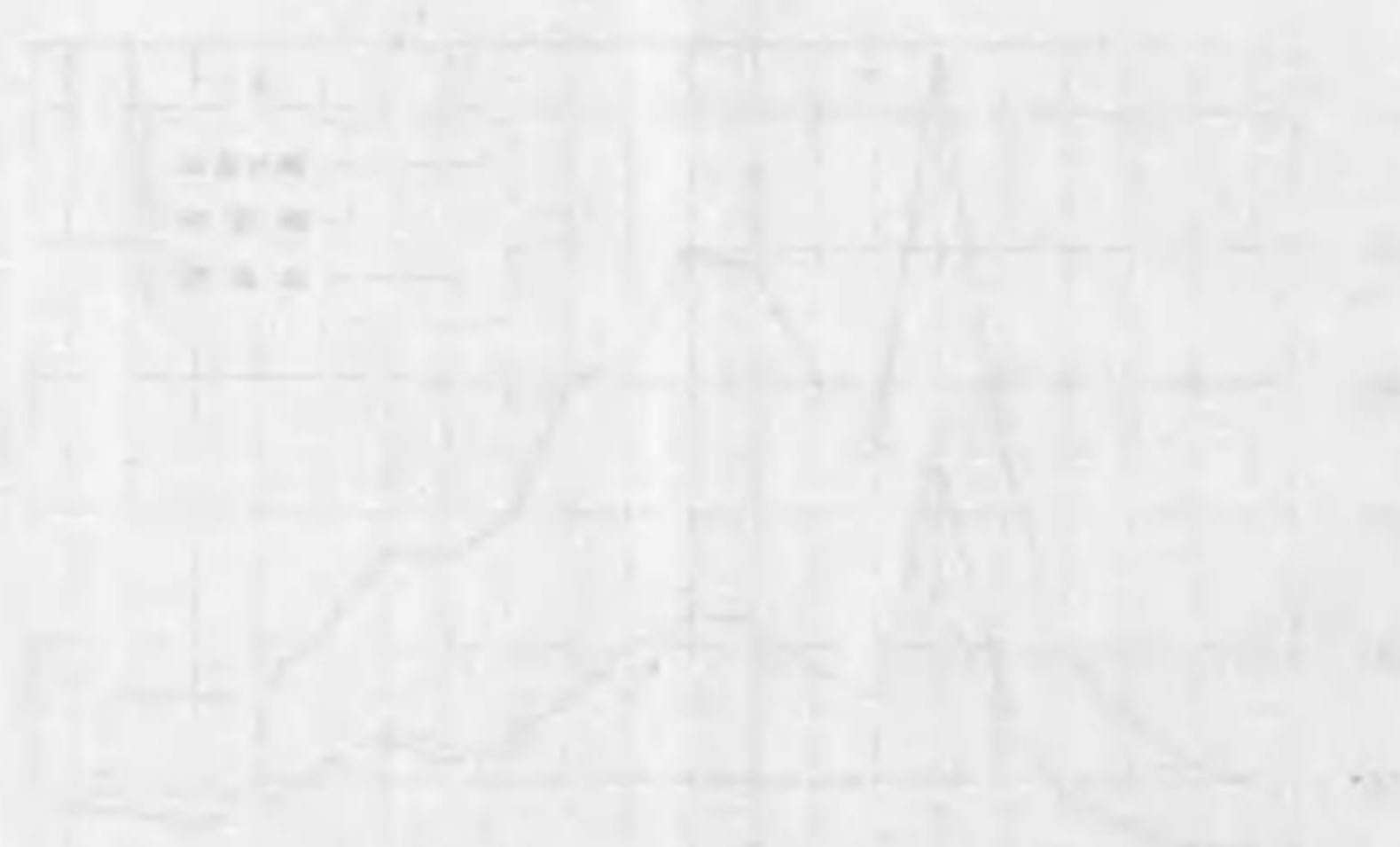
Faint text below the second graph.