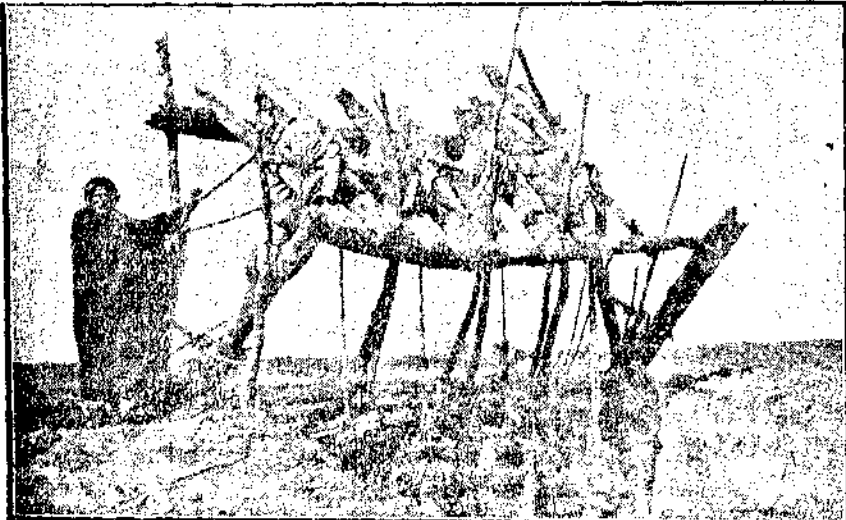
井水之中漠沙大拉阿

學論當一八九九年時刊佈於亞細亞雜誌 Journal asiatique 總上以觀，阿人研究古文化之熱情，可以想見，今日學術發達，為築基於阿拉伯人亦非過論。尤有一端，即阿人注意論理學，彼等一論理學為基本學科傳至今日，此種觀念猶行於西亞，斯亦具有慧眼者也。