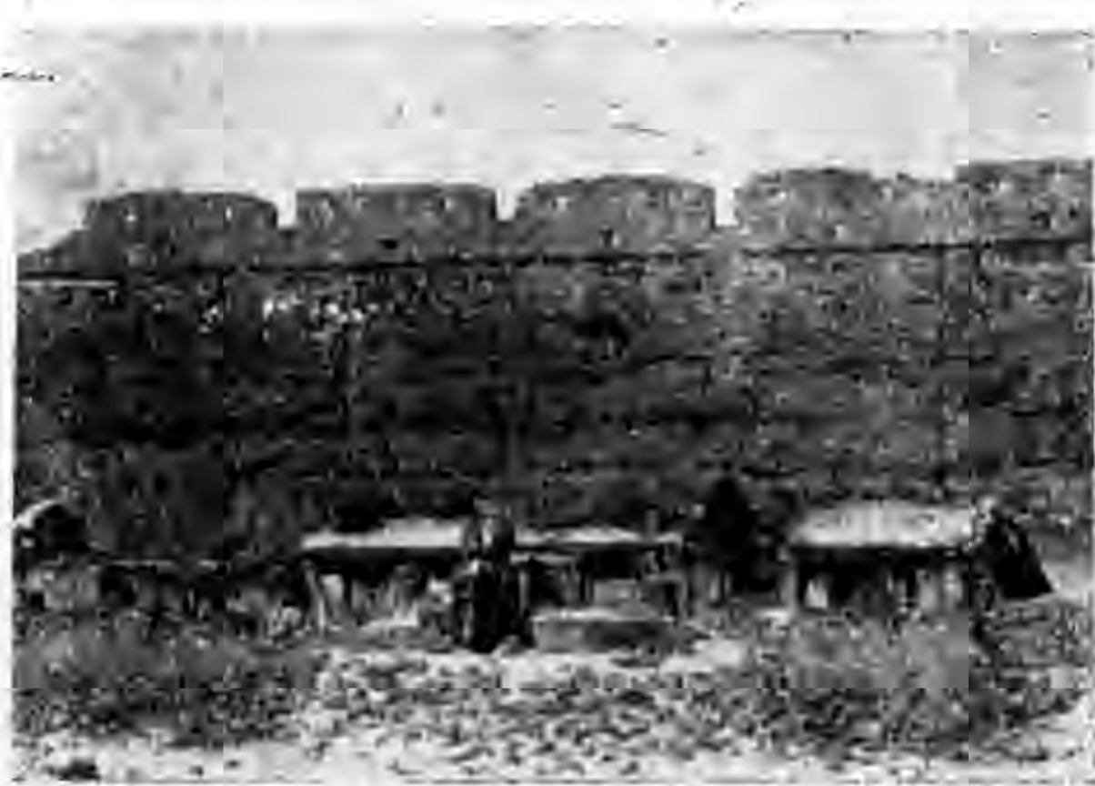
赤城第四區雲州堡南城壕。很多房屋在作戰的時候均被炸燬。圖中所示可見一斑。

秋收頗有希望。又該縣王貂莊互助社六月十三日來函云。該村青苗滿地。長的極茂盛。秋天有豐收的希望。農民們都很歡喜。豐潤楊英莊互助社六月九日來函報告。該村地處極窪。十年九澇。春間雨水