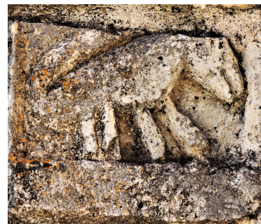
Talla en sillar reutilizado.