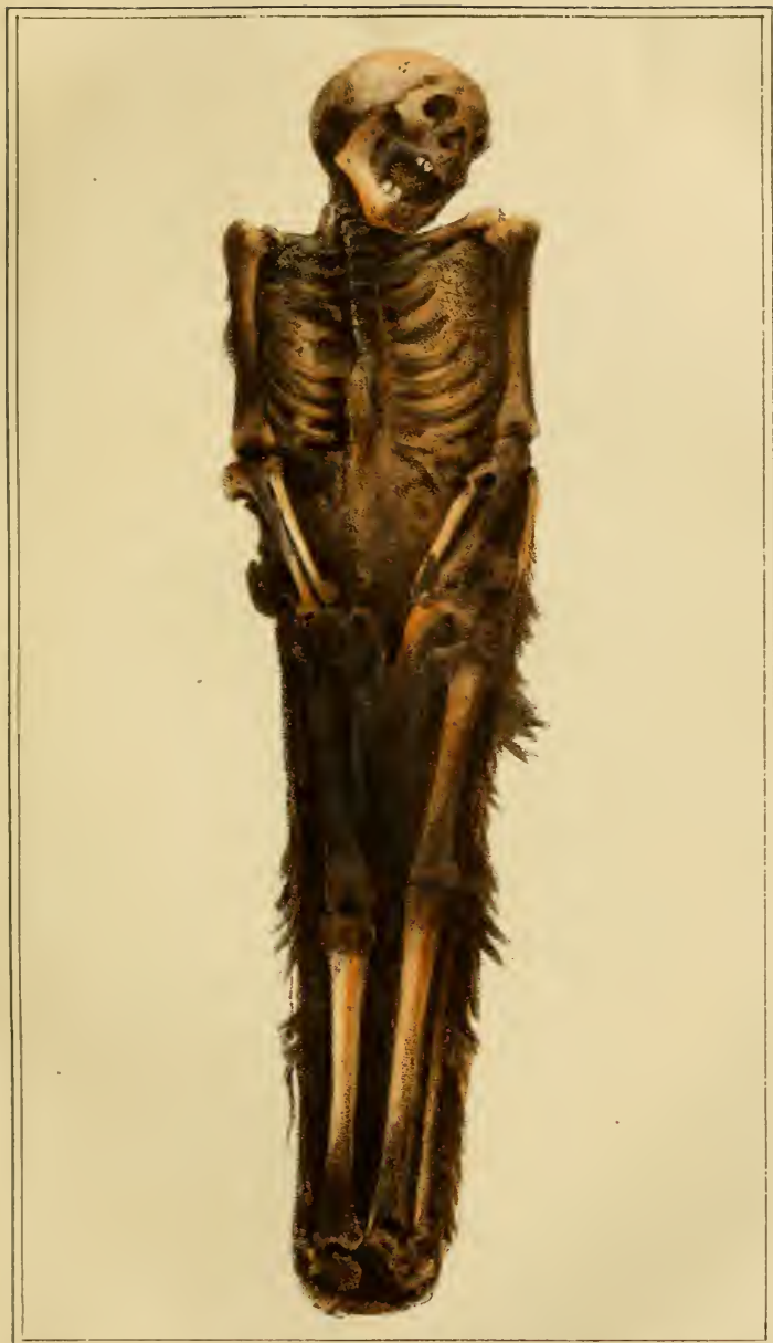
Cadavre humain le 28 Décembre 1826. et humain le 22 Janvier 1828