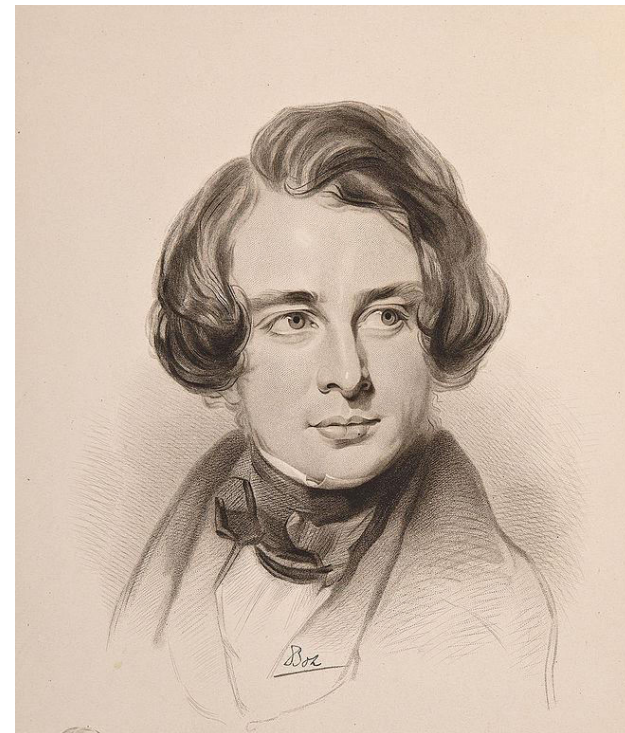
Чарлз Діккенс, 1842. Автор невідомий, суспільне надбання