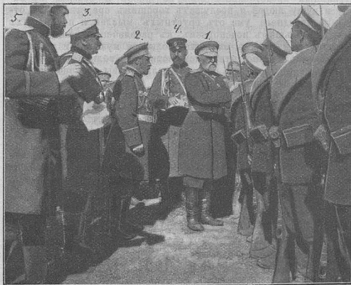
Раздача Георгіевскихъ крестовъ въ 4-мъ Сибирск. арм. корпусѣ: 1. Ген.-адъют. Н. П. Линевичъ. 2. Ген.-адъют. А. Н. Куропаткинъ. 3. Ген.-м. Огановскій—ген. кварт. 1-й арміи. 4. Кап. Колевъ—адъют. главноком. 5. Ротм. князь М. А. Урусовъ—адъют. команд. 1-й арм. (Фотогр. В. Р. Апухтина, собств. корресп.).

Приказъ этотъ прочесть во всѣхъ ротахъ, эскадронахъ,