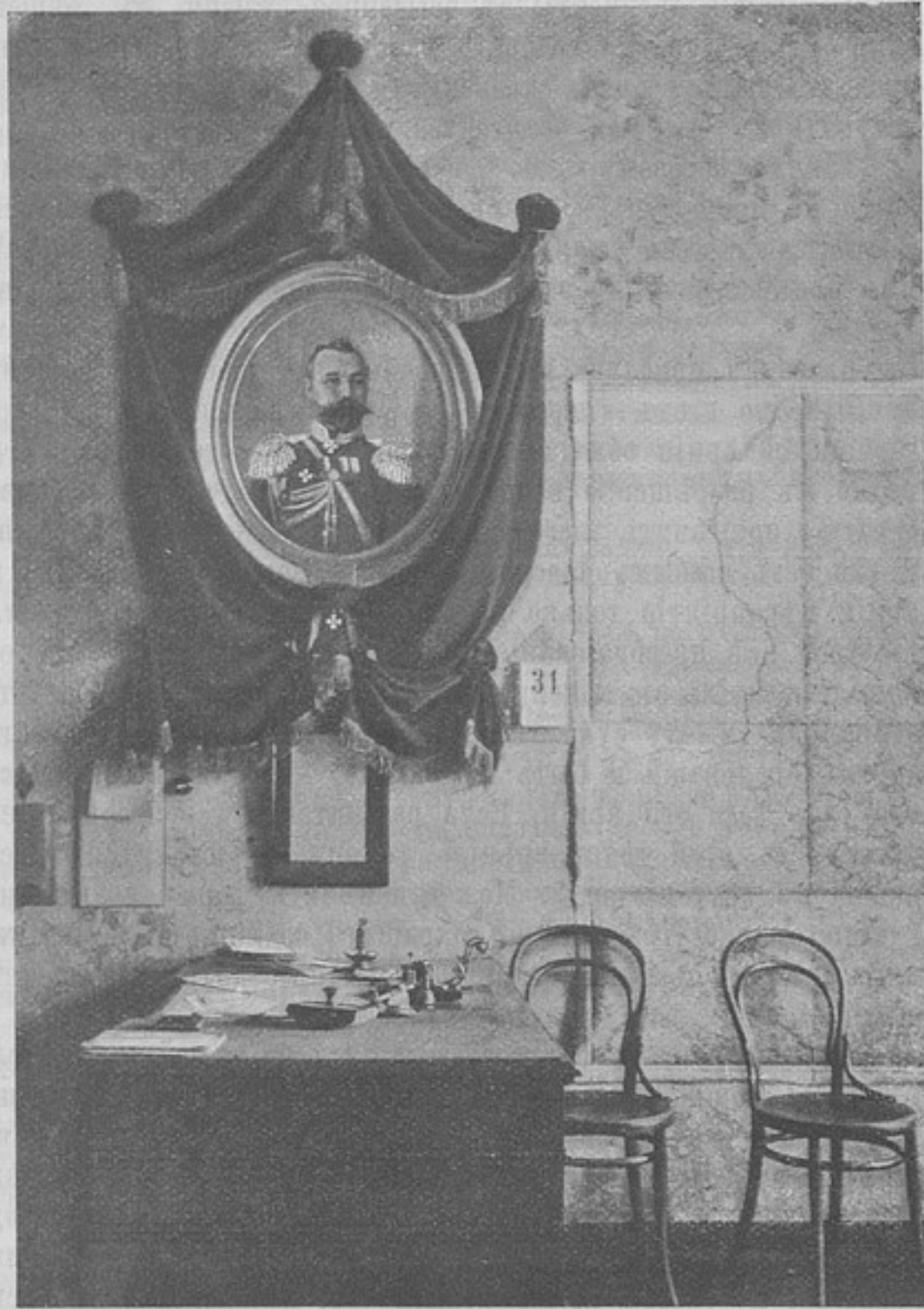
Портретъ ген. Кондратенки въ мобилизаціонномъ отдѣленіи штаба Виленскаго воен. округа старшимъ адъют. котораго покойный былъ съ 14-го октября 1891 г. по 16-е февраля 1893 г. и штабъ офицеромъ для порученій при штабѣ округа съ 16-го февраля 1893 г. по 23-е ноября 1895 г.