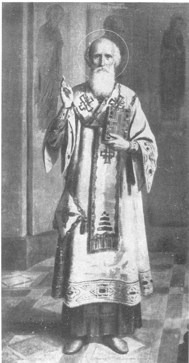
Св. Григорій Богословъ.