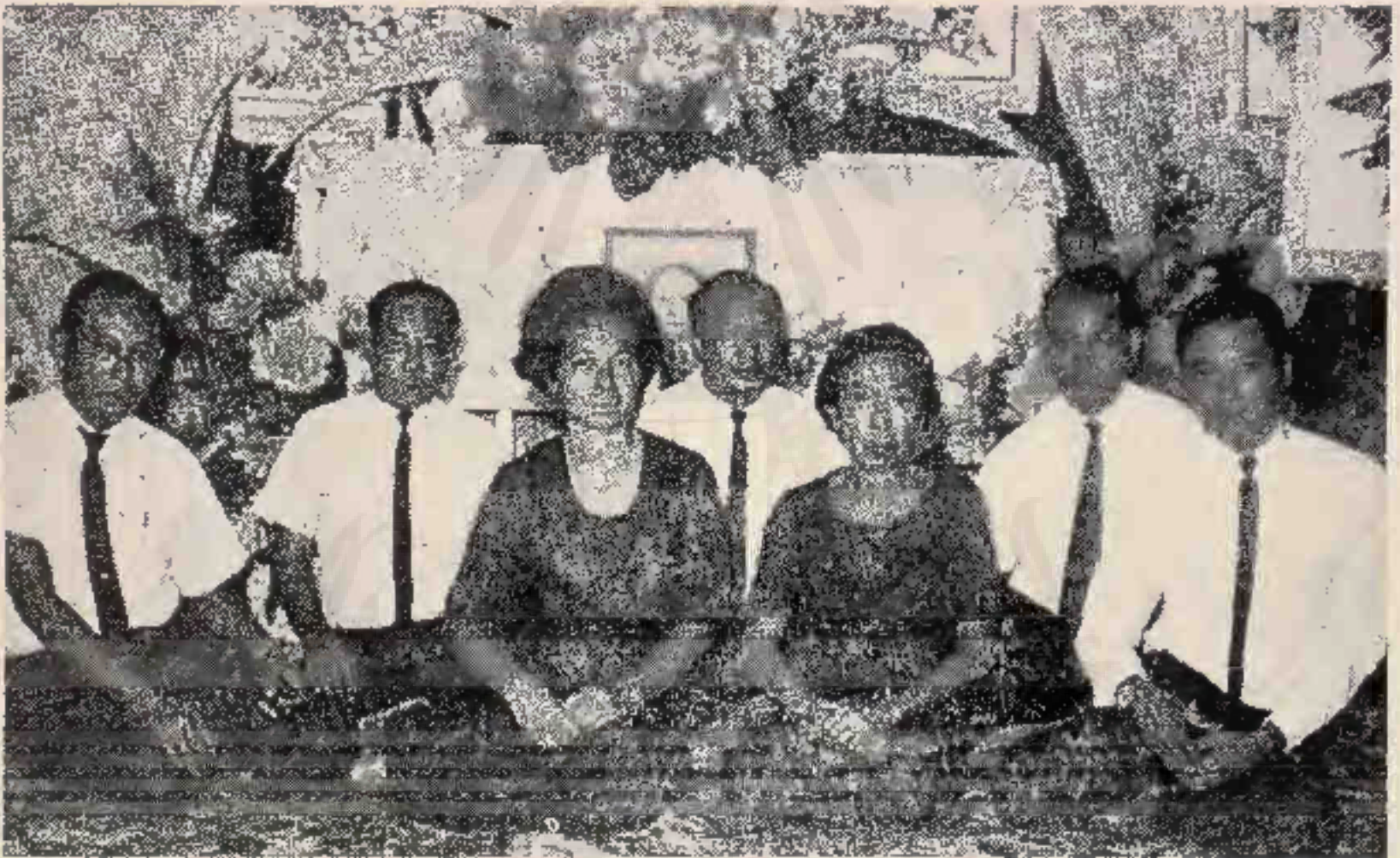
ลูกทุกคนเมอสวดพระอภิธรรมที่บ้าน