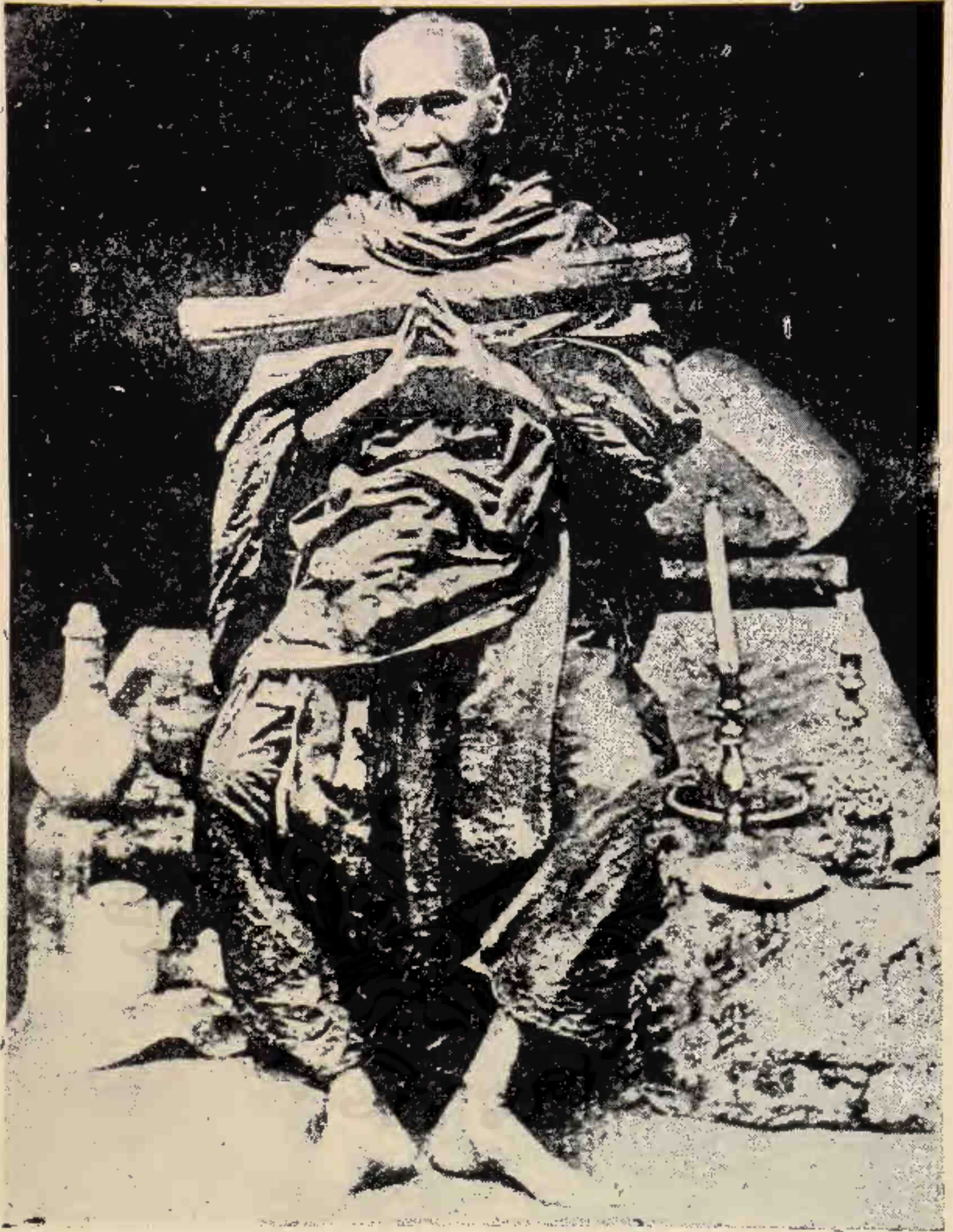
สมเด็จพระพุฒาจารย์ (โต)