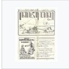
Kajawen 40 1927-10-06.pdf