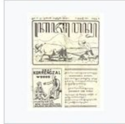
Kajawen 50 1927-12-15.pdf