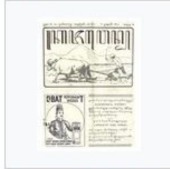
Kajawen 43 1927-10-27.pdf