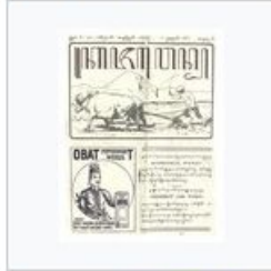
Kajawen 41 1927-10-13.pdf