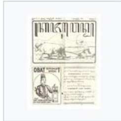
Kajawen 35 1927-09-01.pdf