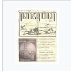
Kajawen 31 1927-08-04.pdf