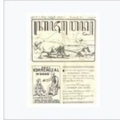
Kajawen 52 1927-12-29.pdf