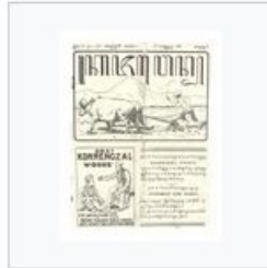
Kajawen 34 1927-08-25.pdf