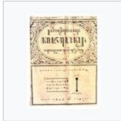
Kajawen 06 1927-02-10.pdf

The following 12 files are in this category, out of 12 total.