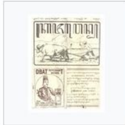
Kajawen 37 1927-09-15.pdf