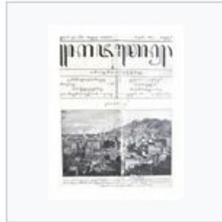
Kajawen 26 1927-06-30.pdf