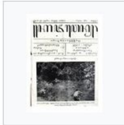
Kajawen 21 1927-05-26.pdf