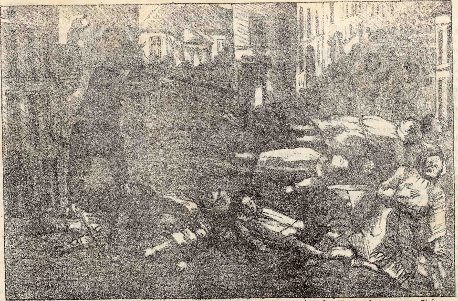
Discursul D LEI Costa- forŪ din senat, recomandătie făcută de D LEA ministerului actual, dieind să aibă milă de Țară cum a avut D LEI eînd era ministru, suvenire din Craiova, Ploesci și Bolgrad. — —