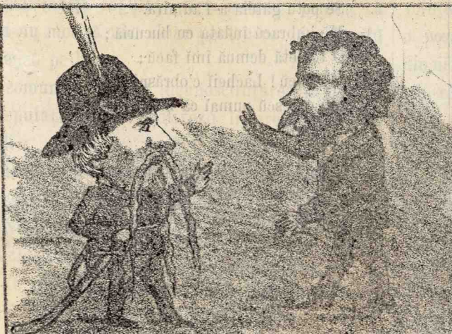
Te am numit inginer topograph al statului major al gardei. — Dar eu nu cunosc ingineria! Parcă eu cunosc arta militară, de sîm ajuns colonel în armată, și acum ajutor al inspectorului general. —