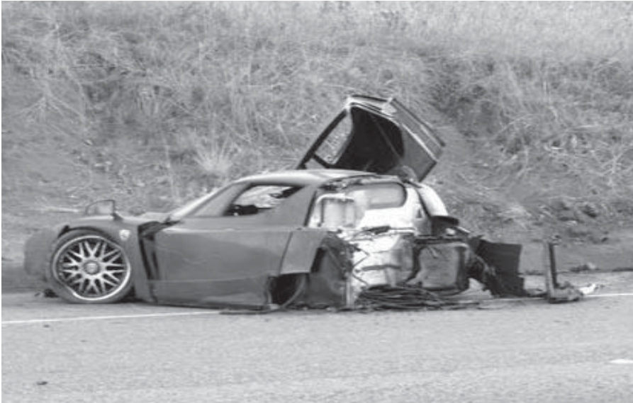
Жахливі наслідки керування автомобілем на високій швидкості у нетверезому стані. Водії, будьте обережні!