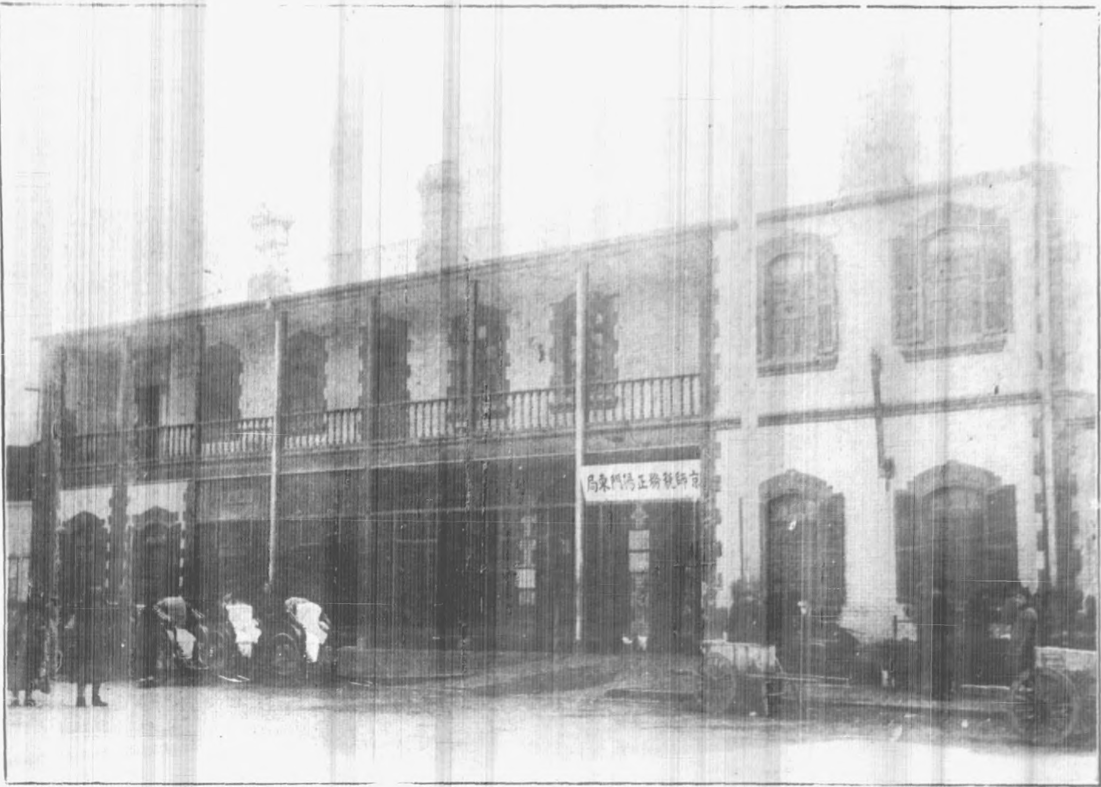
京 師 稅 務 正 陽 門 東 局