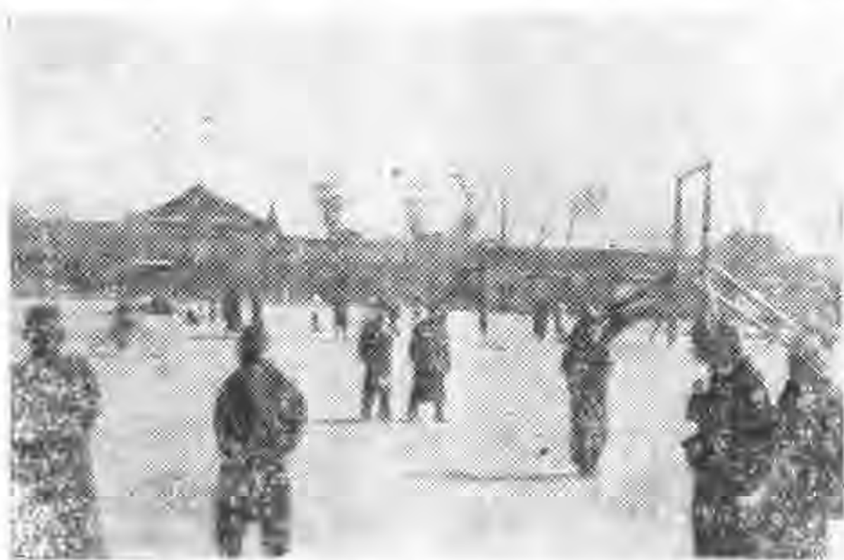
西 安 民 衆 運 動 場