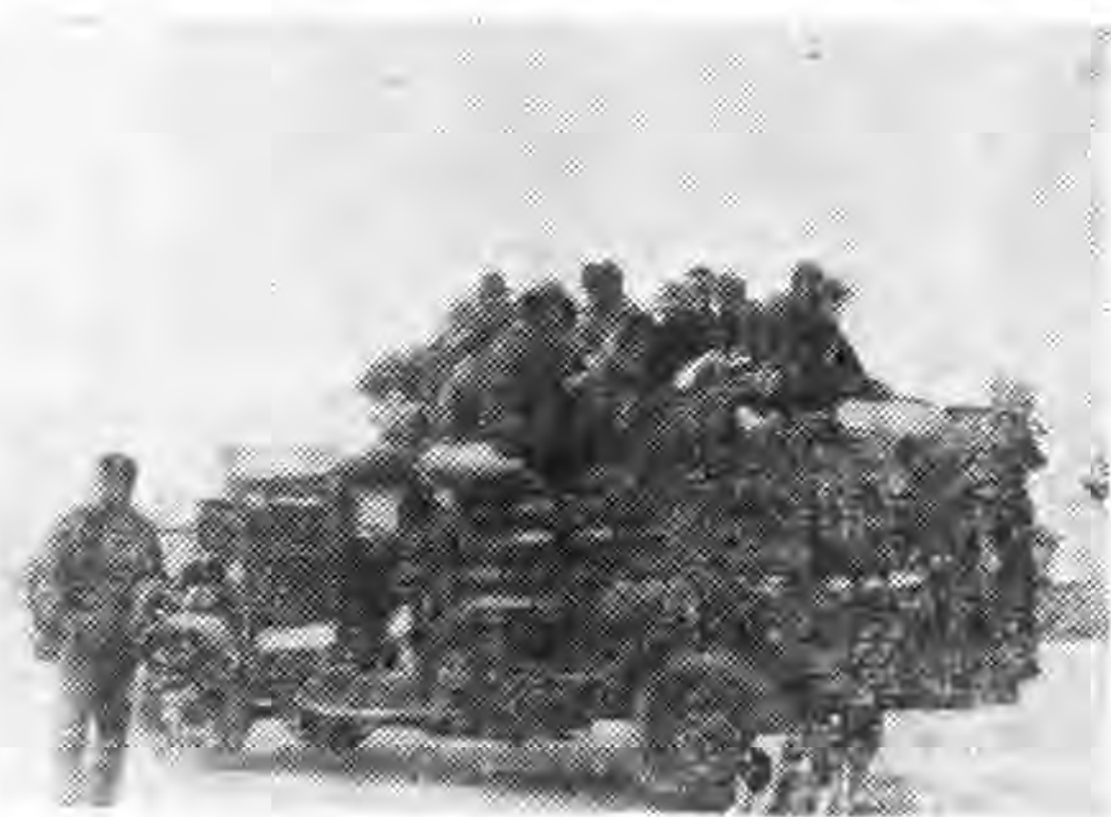
由西安至平涼長途汽車

。問清楚後，遂與購票，計自西安至鑿店票價每位十一元，行李每位限帶三十華斤，如過五十斤加購客票一位。我們因行李太多，每人皆加購客票一位。車票購就，見車上