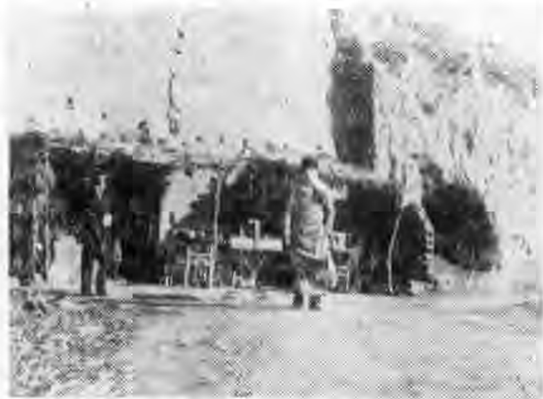
河南張茅附近土洞

高原破裂近旁的削壁間，我以為這破裂的土壁，鑿窰洞，很易崩塌的，可是據經驗者談：土壁破裂，是土質堅硬的顯示，故在此種土壁鑿洞，方無崩塌之危險。車過張茅之後，皆行於高原上，高原形式像山，皆黃土無草石，黃河