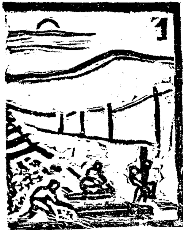
華北工人鐵路破壞隊