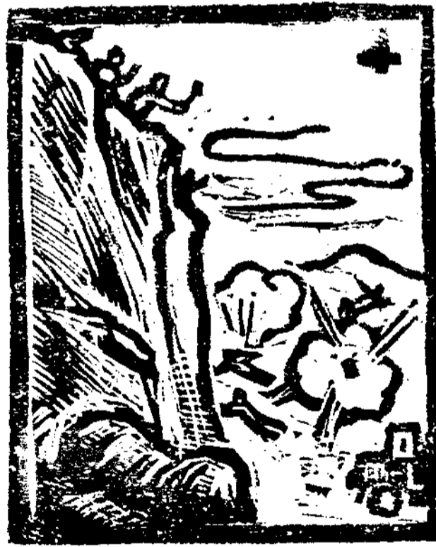
華北工人游擊隊伏擊敵人

這個運動的基本思想，也就是那通牒上所說：「產業是由業主同從業員的各自的職分而聯結的一個有機體，其間階級的對立、利害的衝突等是不存在的，產業的主要使命：在貢獻國家，使國家興隆、國力充實、國民厚生。」主要就是強調勞資一體，產業報國。