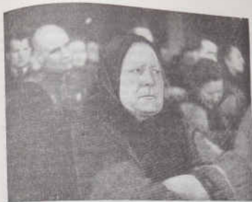
В зале суда.

После некоторого молчания свидетель заявляет, что об этом не знает. В деревнях, куда врвались немецкие солдаты, говорил он, убивали кого попало, а скот и имущество забирали.