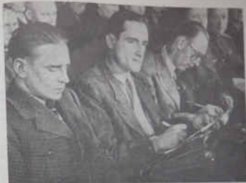
Группа иностранных журналистов в зале суда.

Подсудимый подтверждает, что, несмотря на это, подчиненные ему полицейские органы расстреливали военнопленных.