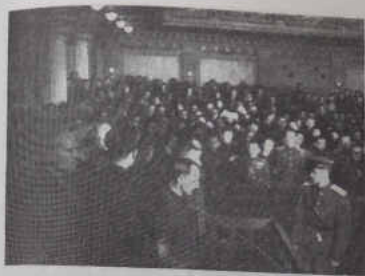
Судящий приговор Военного Трибунала