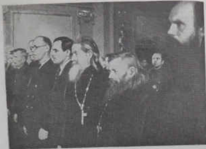
Свидетели выслушивают предупреждение суда об ответственности за дачу заведомо лживых показаний.

Еккельн: Я сообщил Гюмлеру, что он опоздал и что эти ценности уже находятся в твердых руках, т. е. в руках Розенберга.