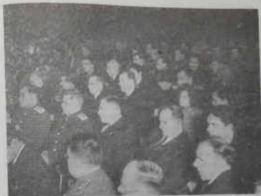
В плен суда.

Еккельн: Я могу назвать подобную провокацию, совер- шенную в Киеве. Там по приказу Гитлера была взорвана Киево-Печерская Лавра. Совершение этого акта было при- писано советским патриотам.