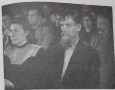
В зале суда.

Здесь, показывает свидетель, практиковались, еще более ужасные методы истязаний и уничтожения арестованных советских людей. Особенно распространен был метод «дезинфекции» барakov. Обычно раздетых догола заключенных выгоняли из барakov в дождь и стужу и через некоторое время снова загоняли в барак, наполненный отравляющим