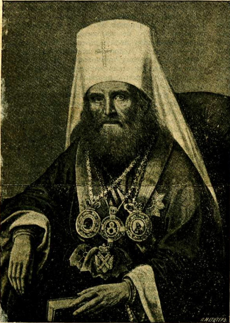
Бозѣ почившій Филаретъ, Митрополитъ Московскій и Коломенскій.