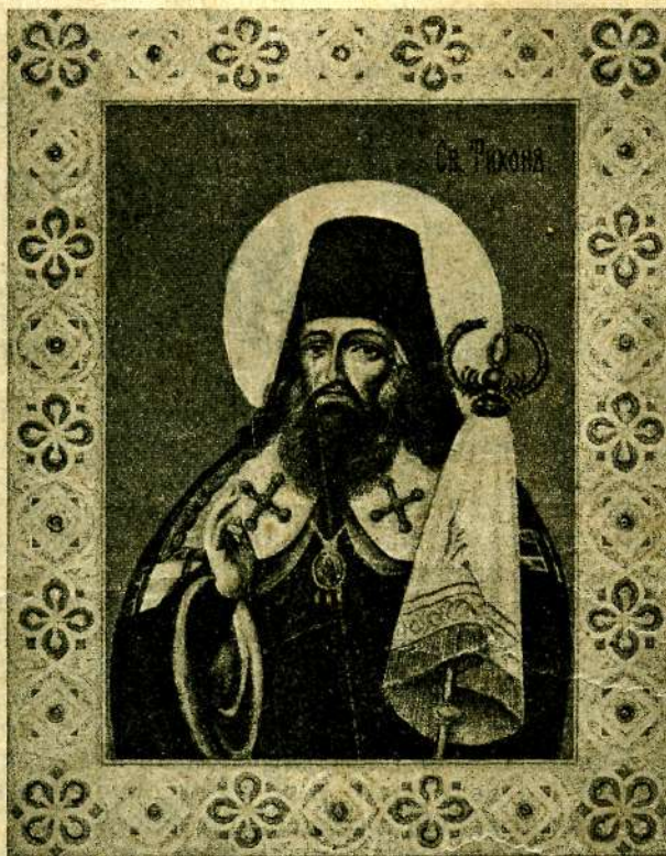
СВЯТИТЕЛЬ ТИХОНЪ, ЕПИСКОПЪ ВОРОНЕЖСКІЙ И ЗАДОНСКІЙ.

Отъ юности возлюбилъ еси Христа, блаженне, образъ всѣмъ былъ еси словомъ, житіемъ, любовію, духомъ, вѣрою, чистотою и смиреніемъ: тѣмъ же и вселился еси въ небесныя обители, идѣже предстоя престолу Пресвятыя Троицы, моли, святителю Тихоне, спаси души наши.