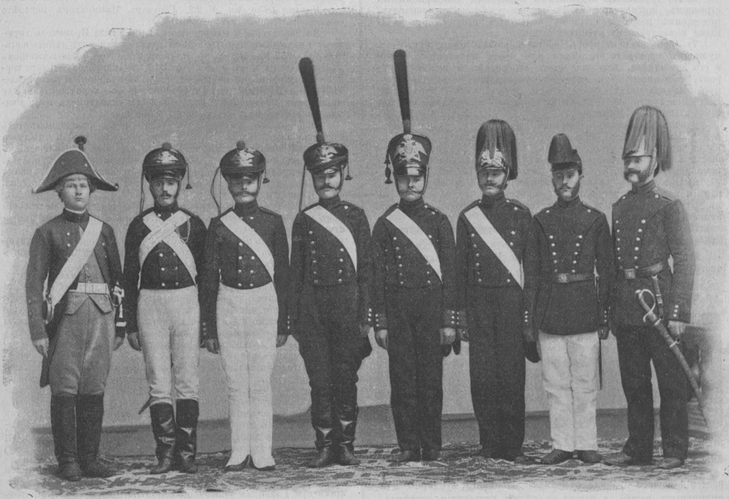
1796 г. 1809 г. 1812 г. 1817 г. 1825 г. 1844 г. 1868 г. 1876 г.