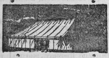
Постановленіе Двора ЕГО ВЕЛИЧЕСТВА

1-й батарея, 7-й стр. бр. арт. бригады нуженъ немедленно хорошо знающій батарею отчетность