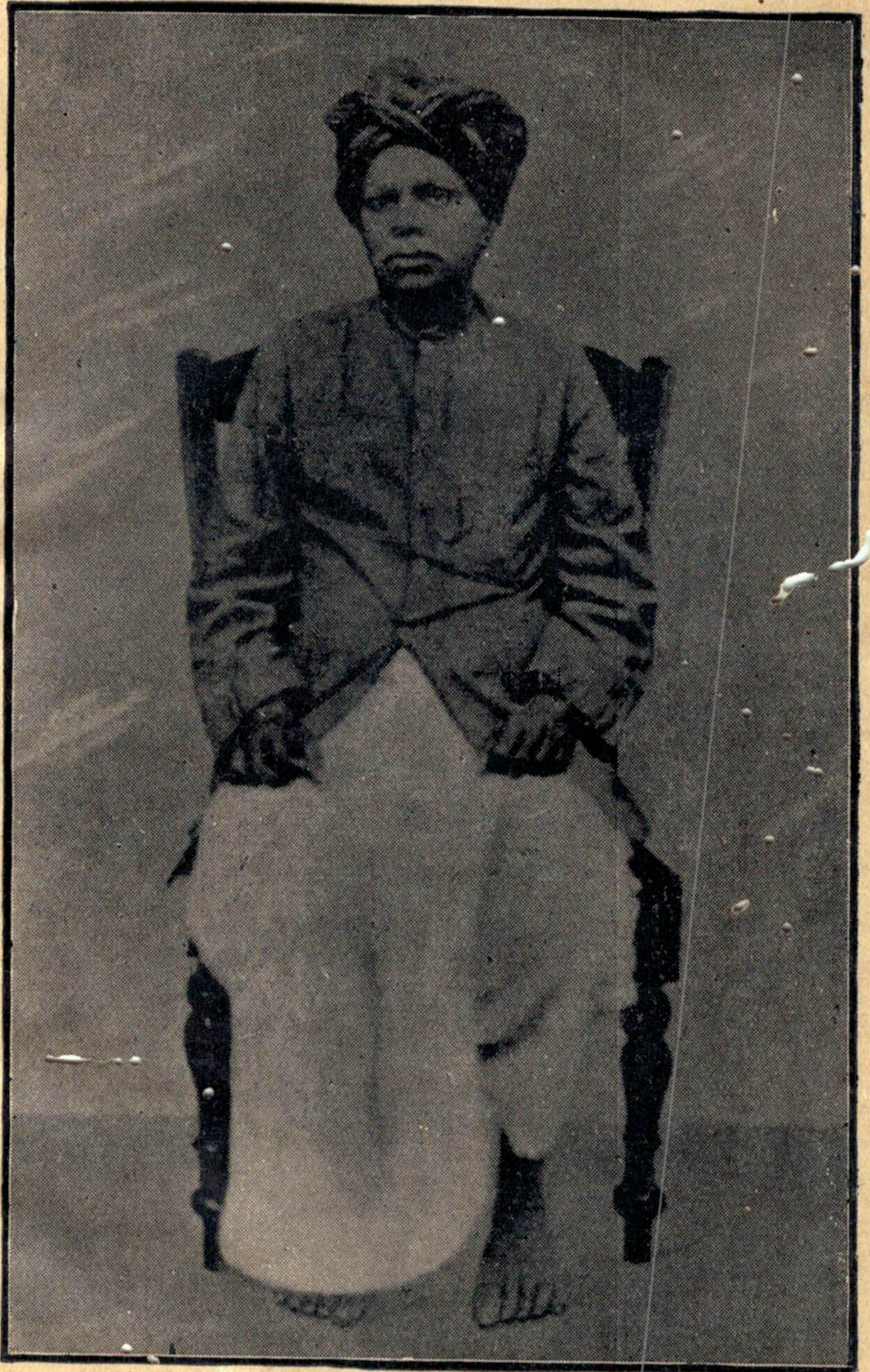
క్రీ. శే. కందుకూరి వీరేశలింగం పఠతులుగారు.