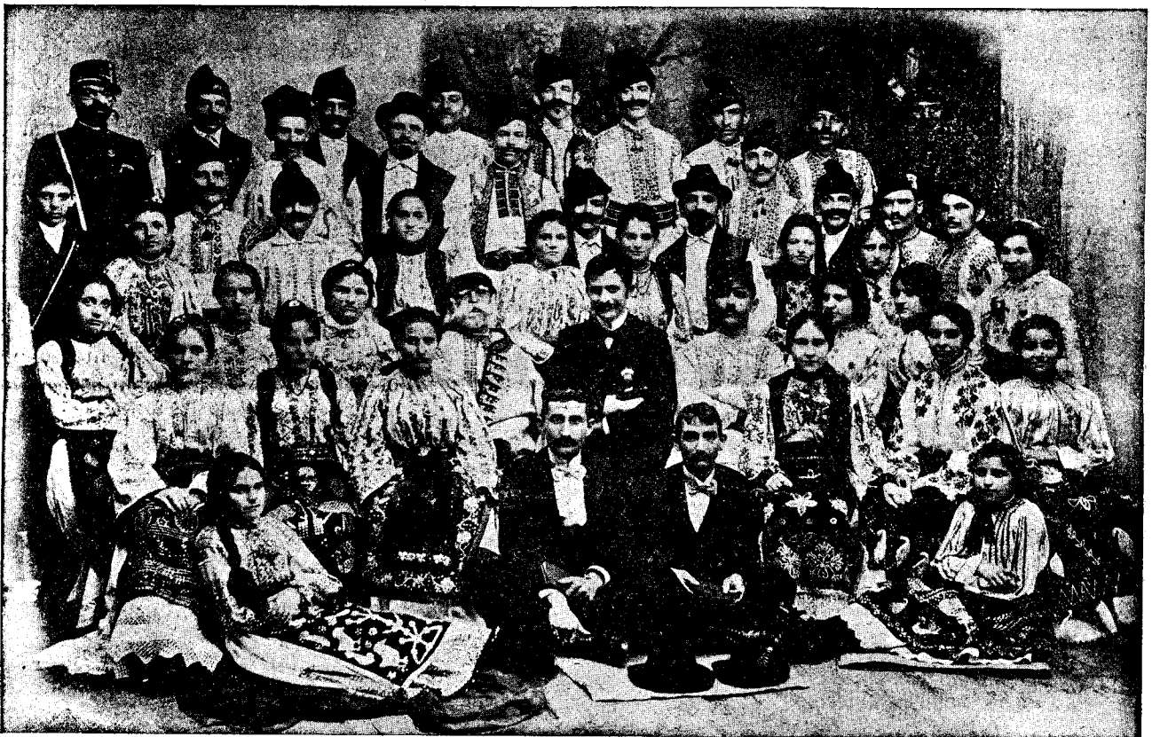
„Ruga dela Chiseteu“ jucată în Recița.

Călugărul Saschi, de câte ori ieșea pe ușa locuinței sale primitive, totdeauna își arunca privirea către poalele dealului. Când era timp limpede, de aici din nălțime ochii săi ageri puteau deosebi lămurit figurile ciobanilor cari plecau cu turma la pășune.