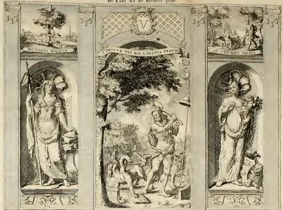
De Kant na de Rechter zyde.