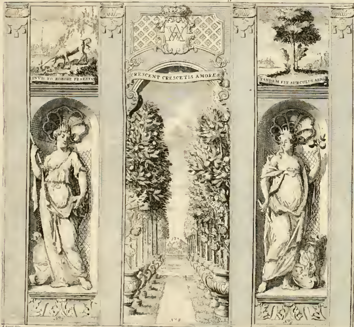
De Kant van Achteren na de Oranje-wal.