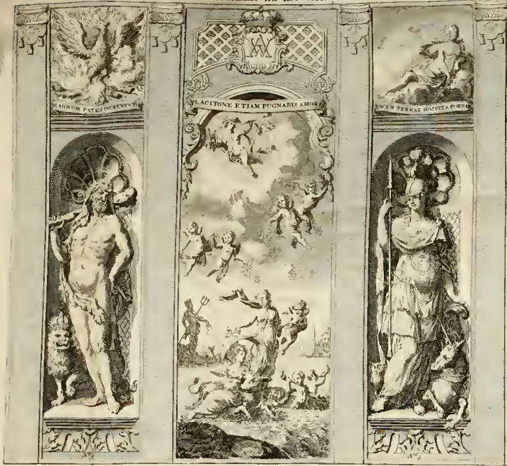
Vertonende de Voorkant na het Vorstelyke Hof.