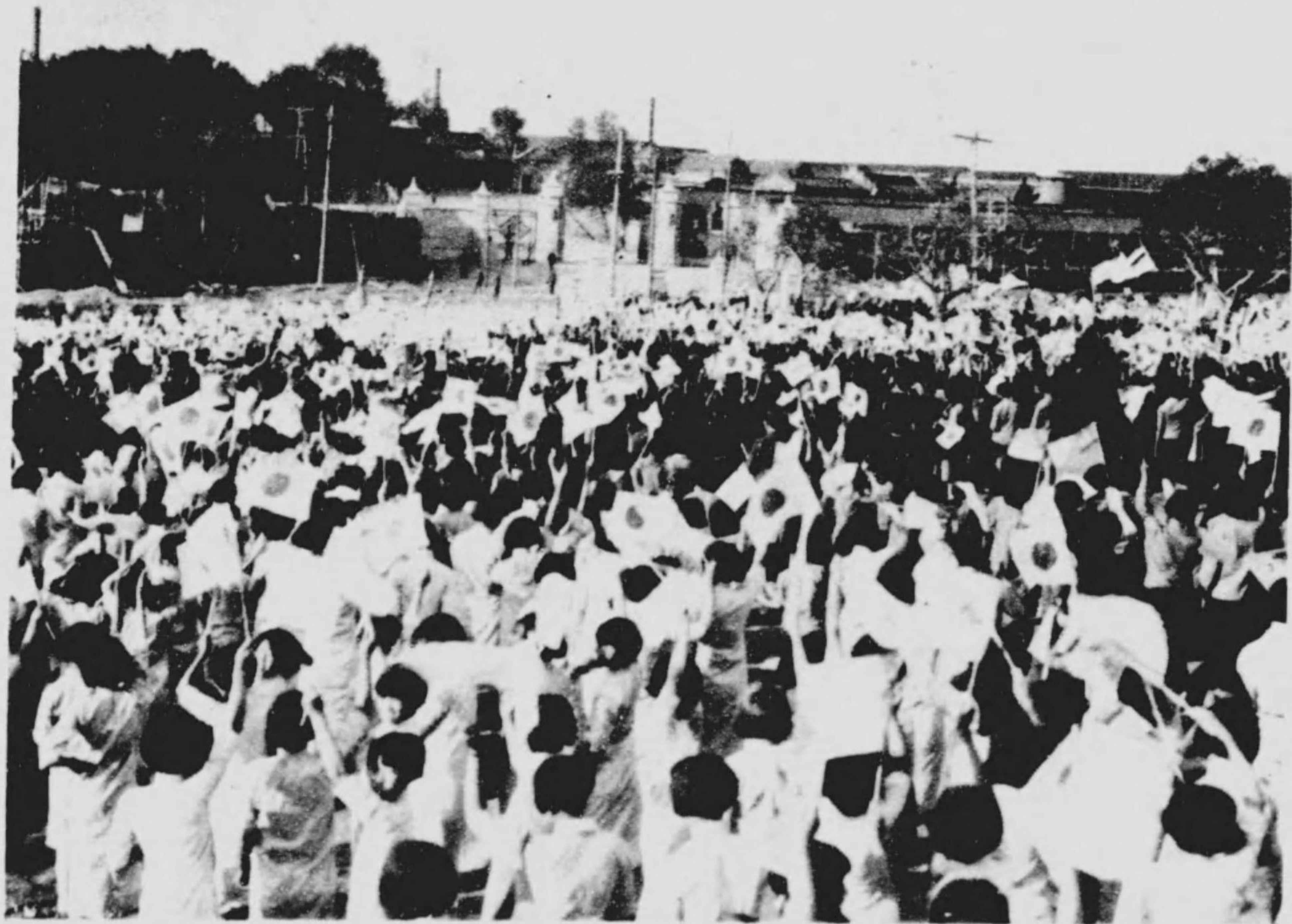
宮内府前ノ慶祝行列