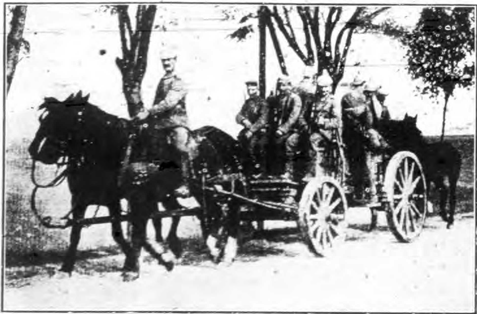
加里斜俄騎隊運送快槍過喀爾巴阡山圖