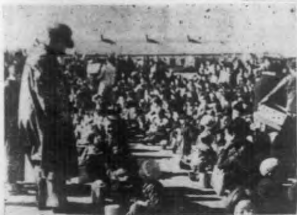
五延百名婦孺待食中 署長親臨視察情形