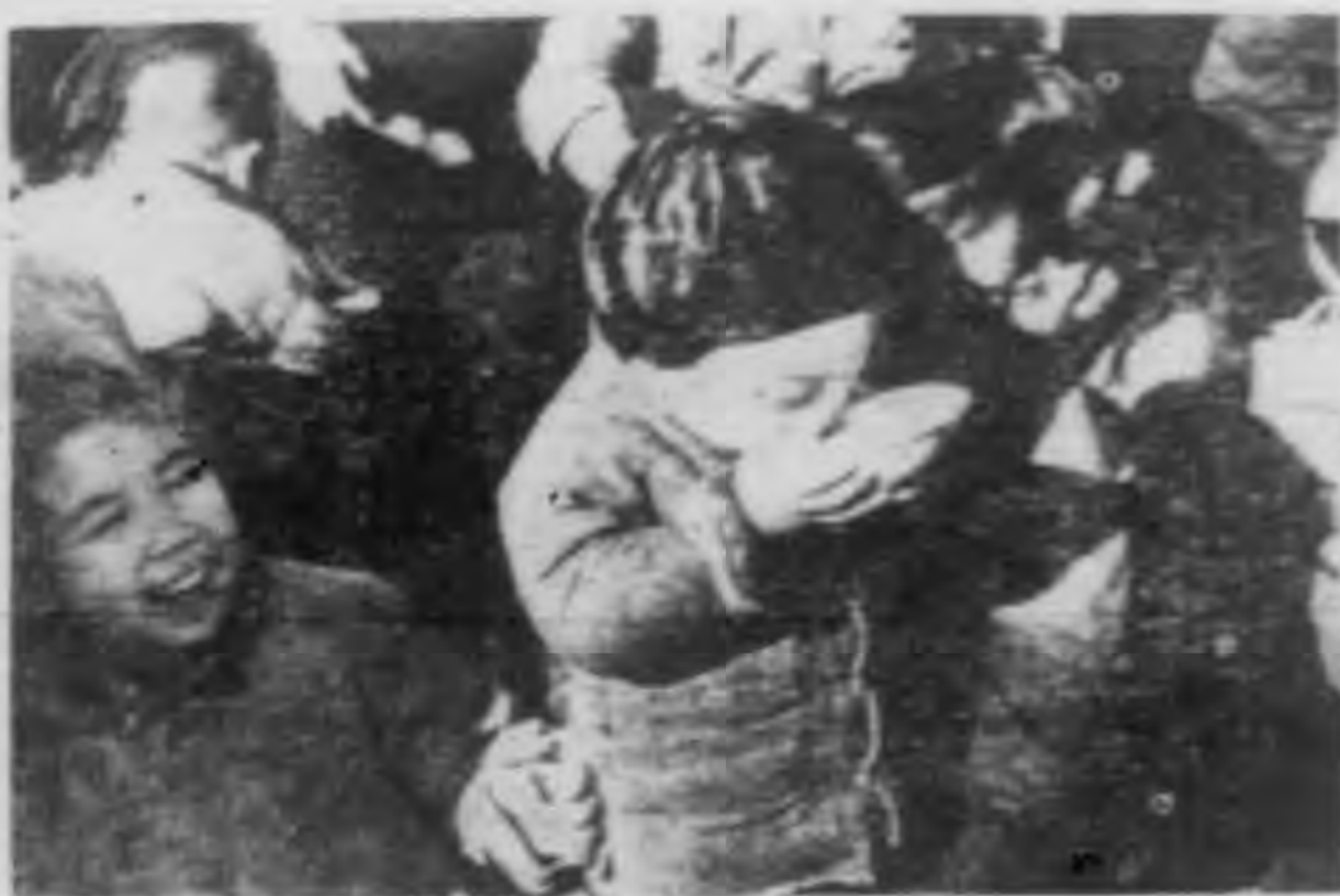
歡新天設喜營地養的站 在的吃角