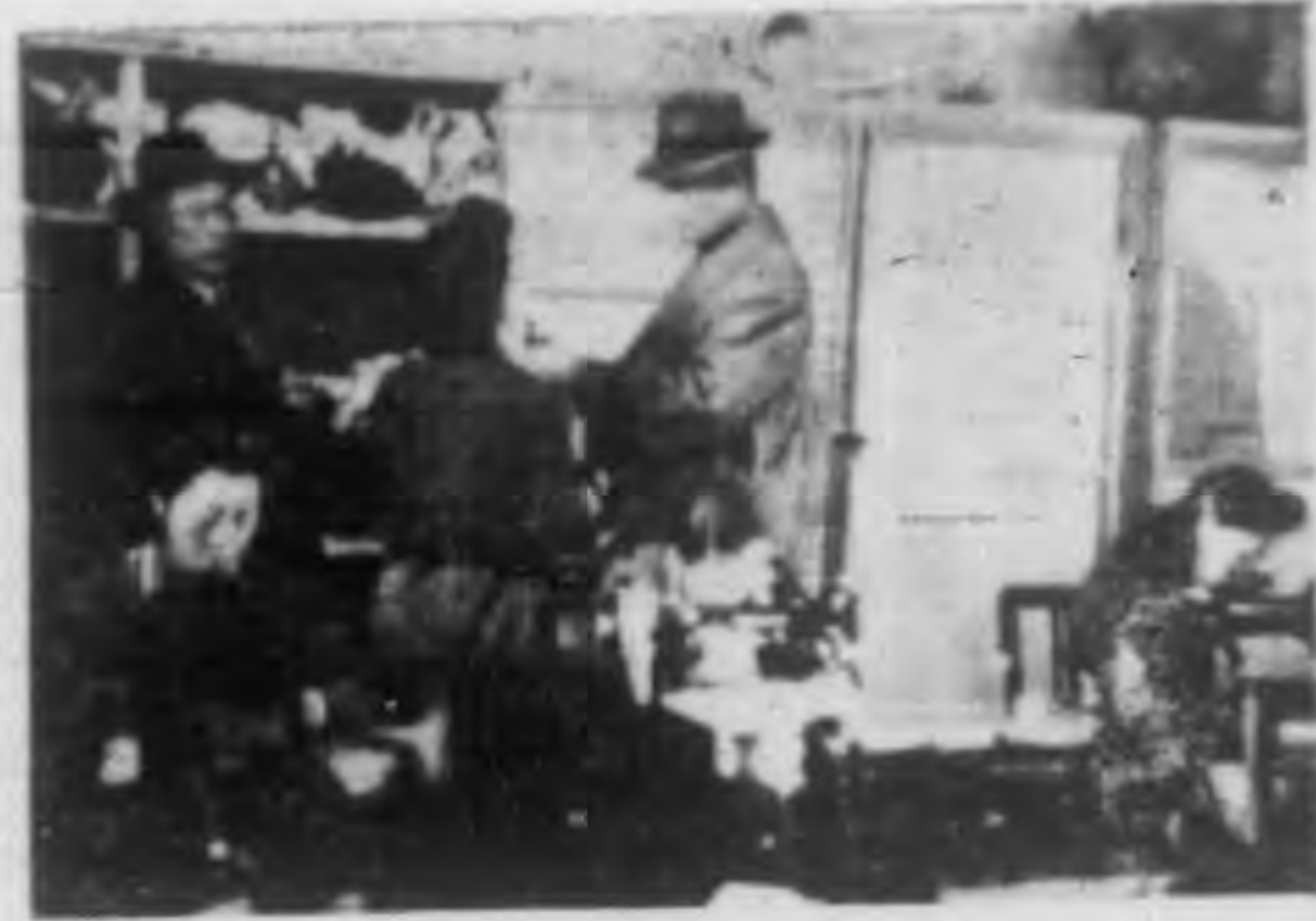
延署長與孫副署長前往視察