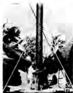
圖洞入插初籬竹(三)

就地而掘下之深度而論。在爪哇地方。須深六米突。因爪哇地下水平面約在地下五米達。須更深一米突。始能得到釀酵作用。故在他處。當視地下水平面之深淺。而定掘地之深淺。總以掘下之深度。至少須較地下水平面深一米突為標準。每處可用至二年以上。茲將其構造詳情述之如左。