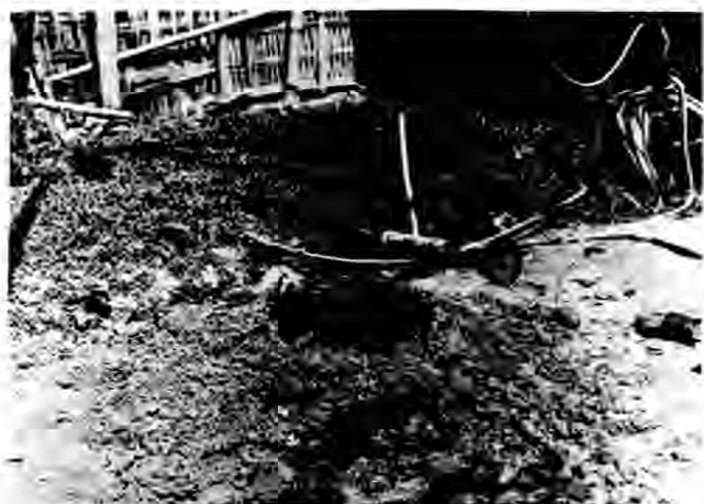
圖 洞 入 插 已 籬 竹 (六)

之鐵管。約長一零四分之一米。突柄之上端。有橫棍。用鐵製或木製。約長二米突。以便縮手旋轉之用。(見附圖一及十)三脚架係用三根一寸半直徑長約五個半米突之鐵棍及一滑車造成。(見附圖十一)以便吊起鑽洞器之用。因鑽洞器鑽泥過深。須利用機械力量始能吊起也。