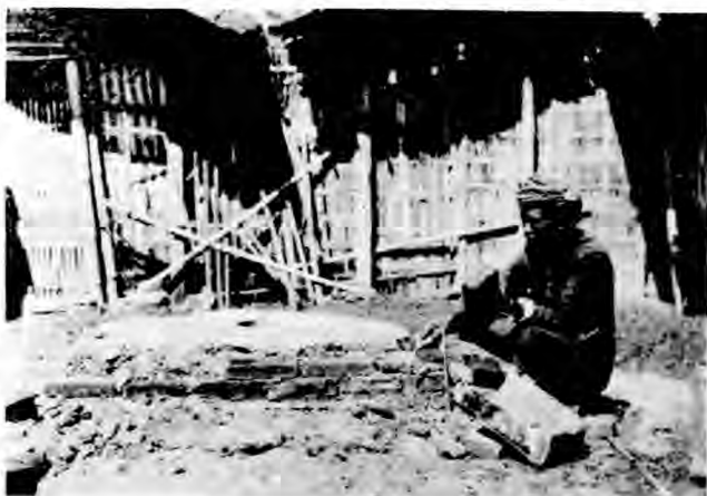
圖 成 已 口 洞 ( 八 )