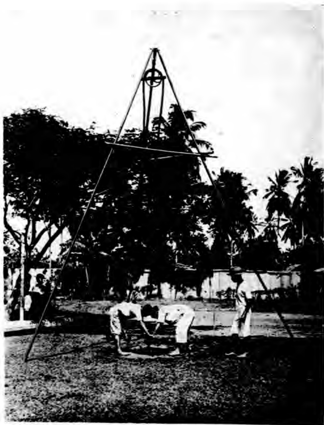
架鐵脚三及况狀洞鑽（一十）