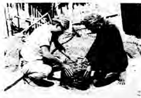
圖入插全將籬竹(四)