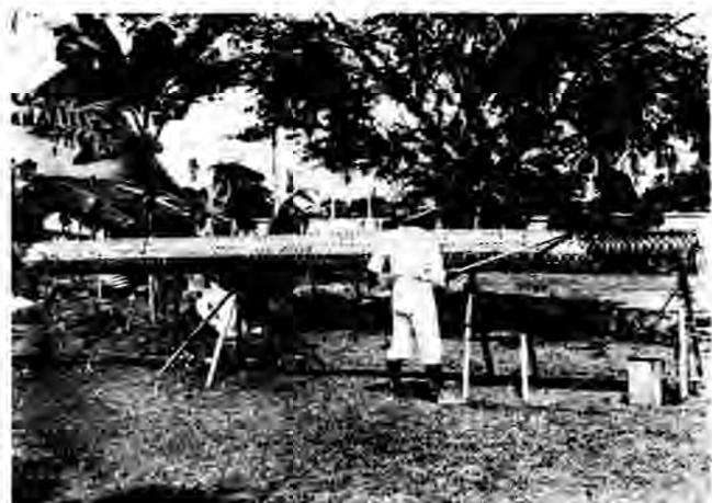
狀之油抹上籬竹（五）

儲糞方法。洞成之後。即就該洞地。而用竹編或茅草搭成小屋（見附圖九）。如在低濕地方。應將廁所屋基加高。或將地板搭高。以免如廁之人為水所阻。