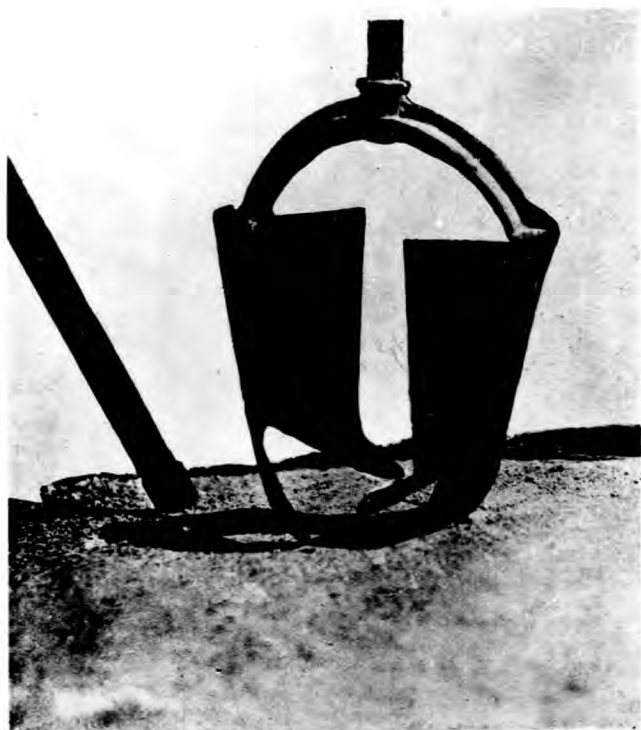
葉兩之端下器洞鑽（十）