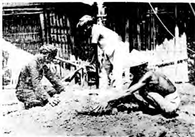
圖 口 洞 築 砌 ( 七 )