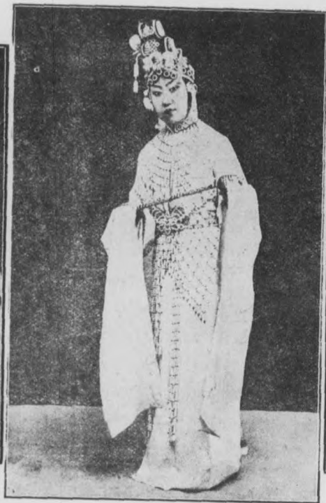
美 芬 蓉 花