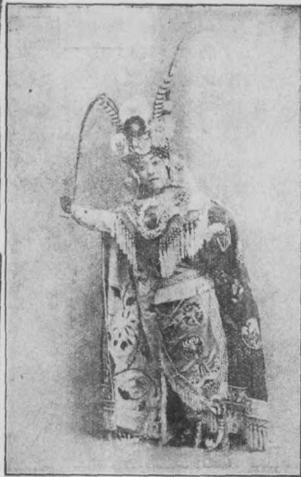
十 三 妹