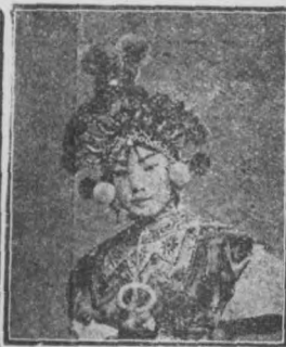
小 鋼 鑽