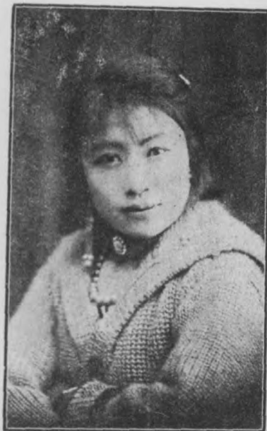
小 靈 芝