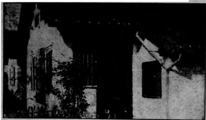
浦東勞工新村甲種住屋