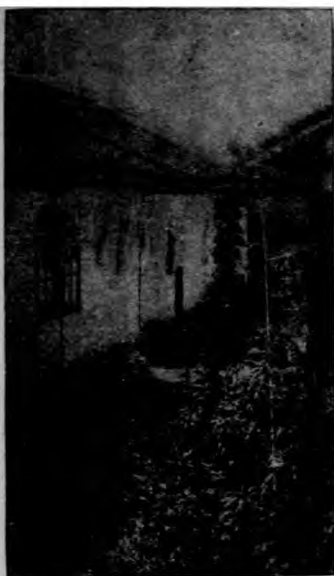
屋住種乙村新工勞東浦

此點，較之國內其他類似之社團，實有過之無不及。且村友已知其對於該村成敗之責任，故大小公益，大都樂意參加，村友中間有不幸者，其他村友多能犧牲協助。