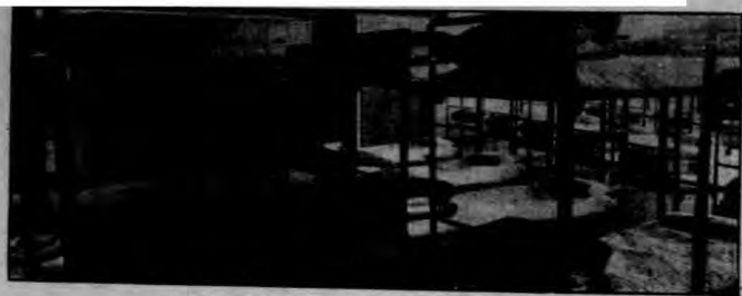
人力車夫互助會宿舍