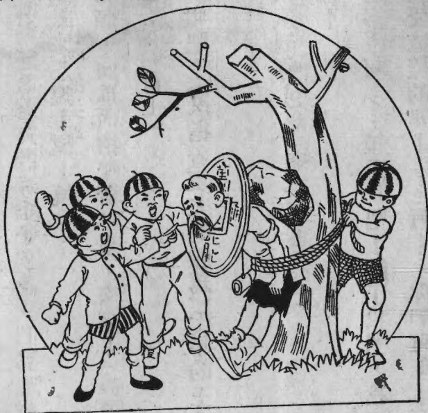
更夫被綁在樹上。一着大石頭。