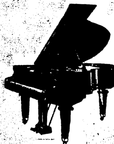
5 pieds Grand, $675 comptant. 5 pieds 7 pouces Grand, $725 comptant. 6 pieds 5 pouces Grand, $800 comptant. Conditions—$25 par mois, 6 pour cent arajou.