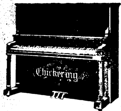
4 pieds 2 pouces droit, $500 comptant. Conditions—$12 par mois, 6 pour cent arajou. 4 pieds 6 pouces droit, $550 comptant. Conditions—$12.50 par mois, 6 pour cent arajou.