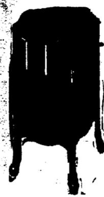
Victrola X, 40 Records. Prix $82.50. Conditions—Un quart comptant, le solde en six paiements mensuels égaux.