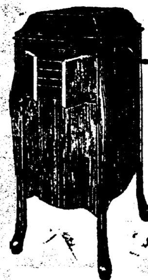
Victrola XI, 12 Records. Prix $109. Conditions—Un quart comptant, le solde en six paiements mensuels égaux.