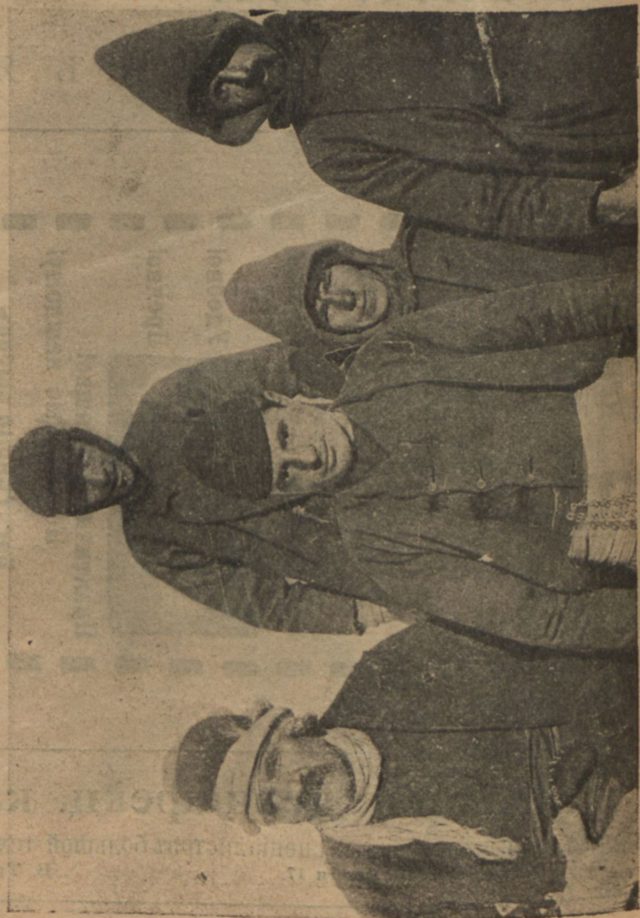
Плѣнные болгарскіе комманданты.