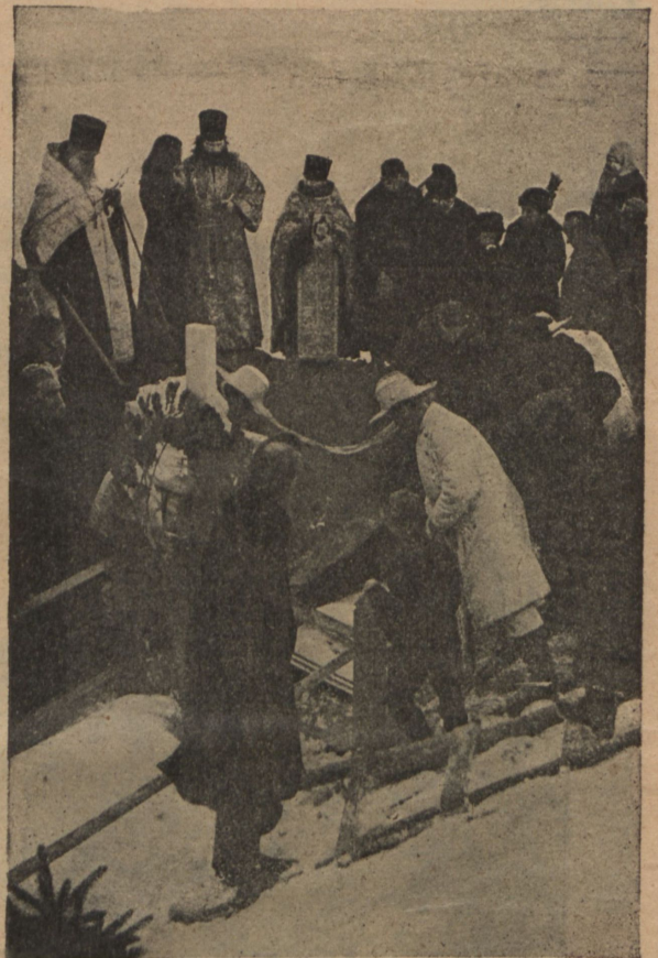
Опускание гроба въ могилу.