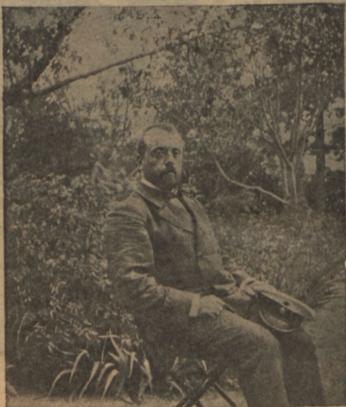
Е. Г. въ должности судьи (въ 1904 г.).