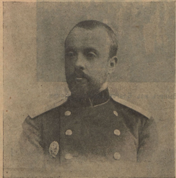
Е. Г. на военной службѣ (въ 1895 г.).

бывшій членъ первой госуд. думы. (Скончался въ ночь на 9-ое январа 1916 г.).