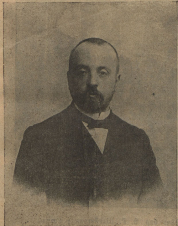
Послѣдняя фотографія Е. Г.