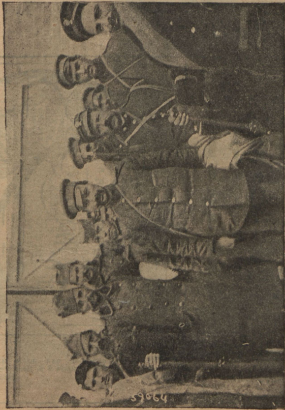
Арестованные болгары, пытавшіеся перейти границу въ сербской формѣ.