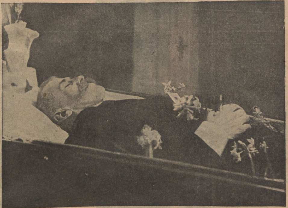
Извѣстный польскій общественный дѣятель и ученый проф. Иосифъ Милевскій, на-дняхъ скончавшійся въ Кіевѣ.