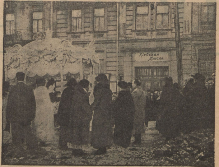
Панихида у редакціи „Кіевской Мысли“.