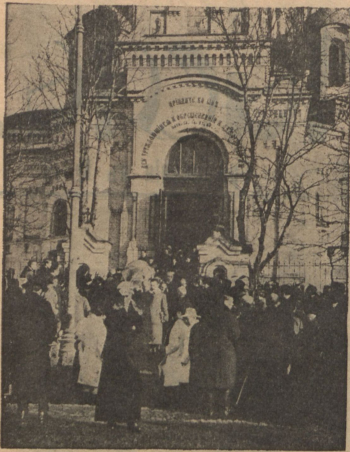
Выносъ изъ Благовѣщенской церкви.