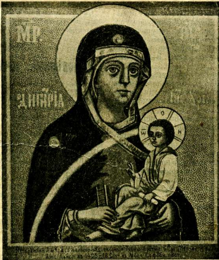
Изображеніе Божіей Матери „Молчанскія“, явилась въ 1405 г. 18 сентября въ Молчанско-Софроніевой пустыни.

О, Владычице преблагословенная, защитнице рода христіанскаго, прибѣжище и спасеніе притекающихъ къ Тебѣ! Вѣмъ, воистину вѣмъ, яко зѣло согрѣшихъ и прогнѣвахъ, премилостивая Госпоже, рожденнаго плотію отъ Тебе Сына Божія: но вѣмъ многія прежде мене прогнѣвавшихъ Его благоутробіе грѣшники, имже дадеся прощеніе грѣховъ ихъ, покаяніа ради и исповѣданія. Тыя убо представляя и на толикое Божіе милосердіе, онѣхъ пріемшее, взирая, дерзнухъ и азъ грѣшный прибѣгнути съ покаяніемъ ко Твоему благоутробію. О, Всемиловитая Владычице, да подаши ми руку помощи и испросиши у Сына Твоего и Бога матерними и святѣйшими Твоими молитвами тяжкимъ моимъ грѣхамъ прощеніе. Вѣрую и исповѣдую Тебе быти истинную Бо-