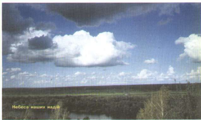
Небеса наших надій