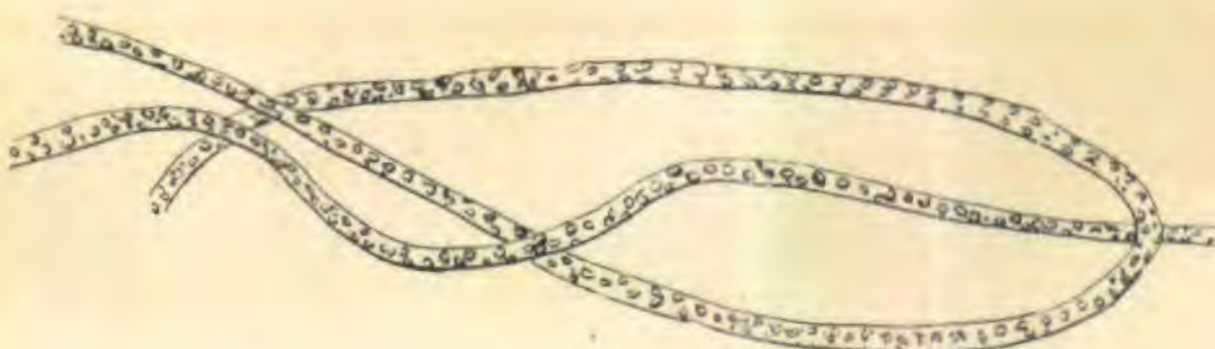
Beggiatoa alba Kg. var. marina.