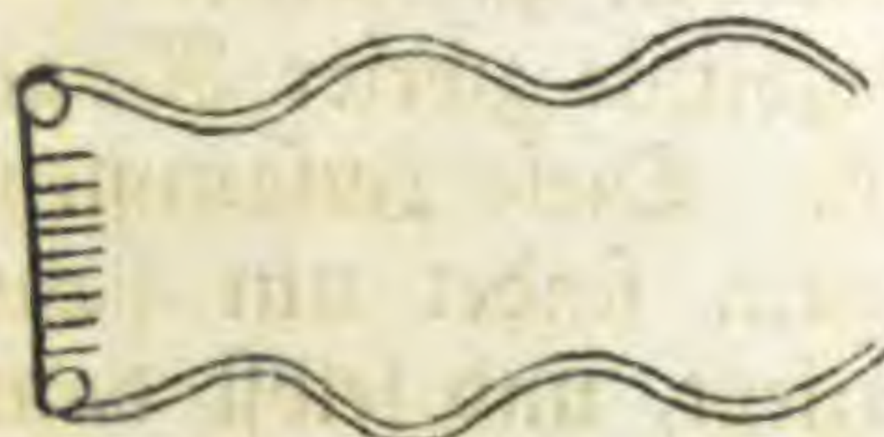
Fig. 3. \frac{300}{1}