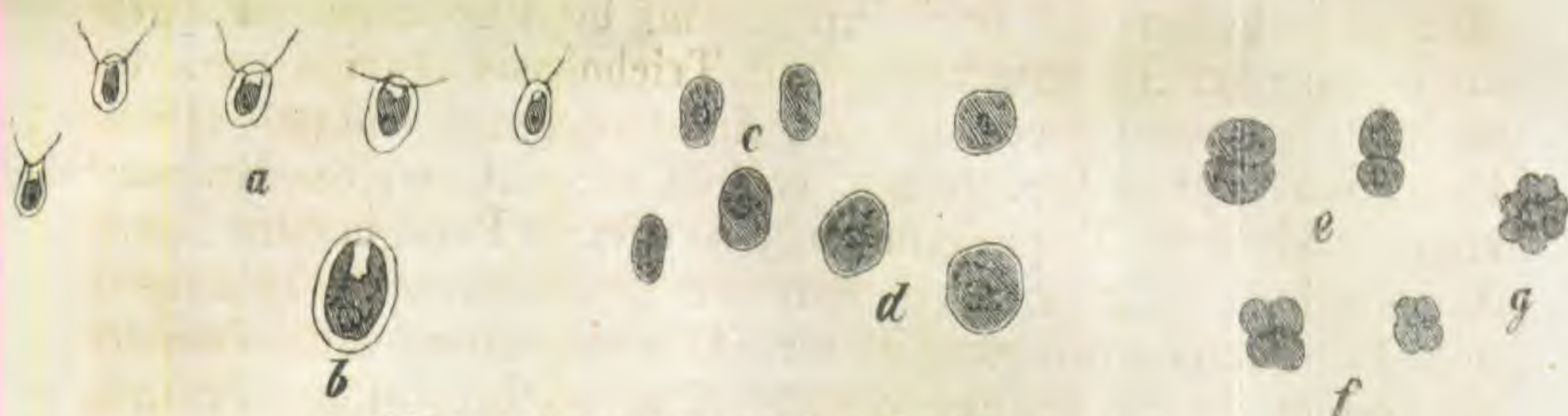
Chlamydomonas marina Cohn.

Chlamydomonas marina Cohn. ( Diselmis marina Duj.?) cellulis mobilibus viridibus ovalibus \frac{1}{600}'' (0,004 mm.) longis, ciliis duas apici hyalino insidentes gerentibus, membrana (chla- myde) ampliata hyalina achroa ovali \frac{1}{400}'' (0,006 mm.) longa inclusis, demum in cellulas immobiles plus minus globosas \frac{1}{320} — \frac{1}{260}'' longas commutatis, e quibus divisione succedanea aut macrogonidia 4 aut microgonidia permulta erumpunt. In Aqua- rio marino aquam viride colorans vel membranula superne natante obtegens; agilis mense Majo, dein immobilis. Wra- tislaviae 1865.