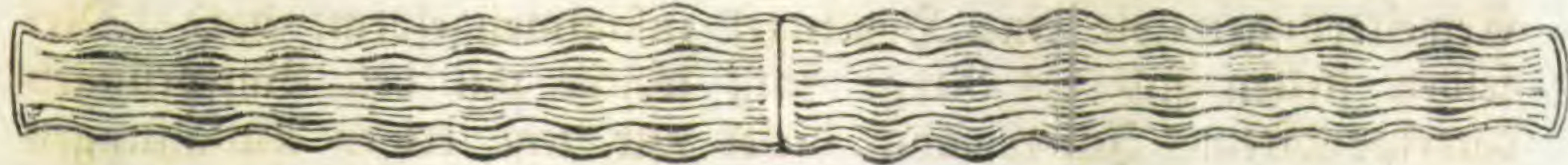
Fig. 2. \frac{510}{1}