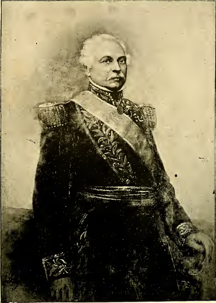
General José Antonio Páez