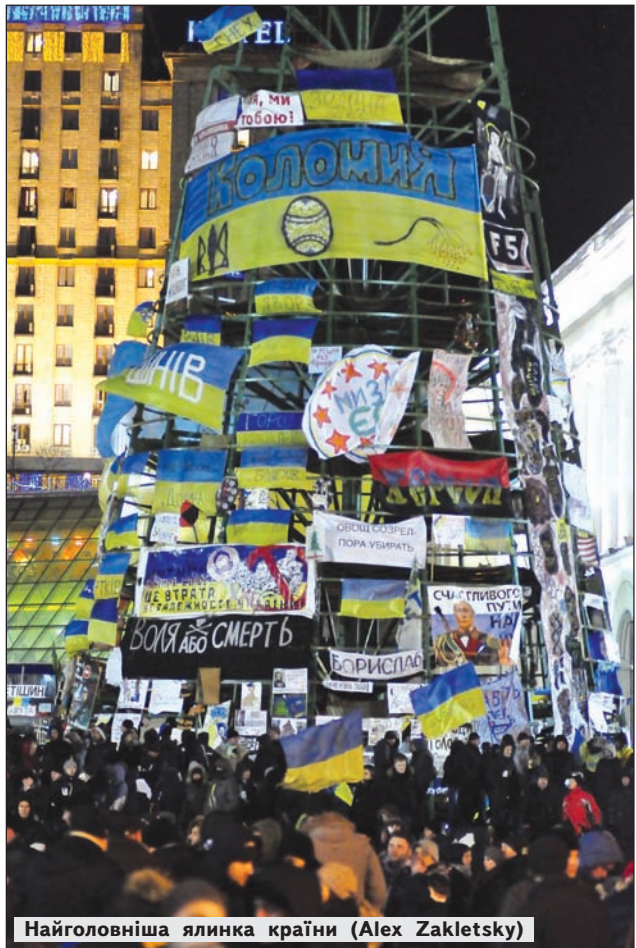
Найголовніша ялинка країни (Alex Zakletsky)