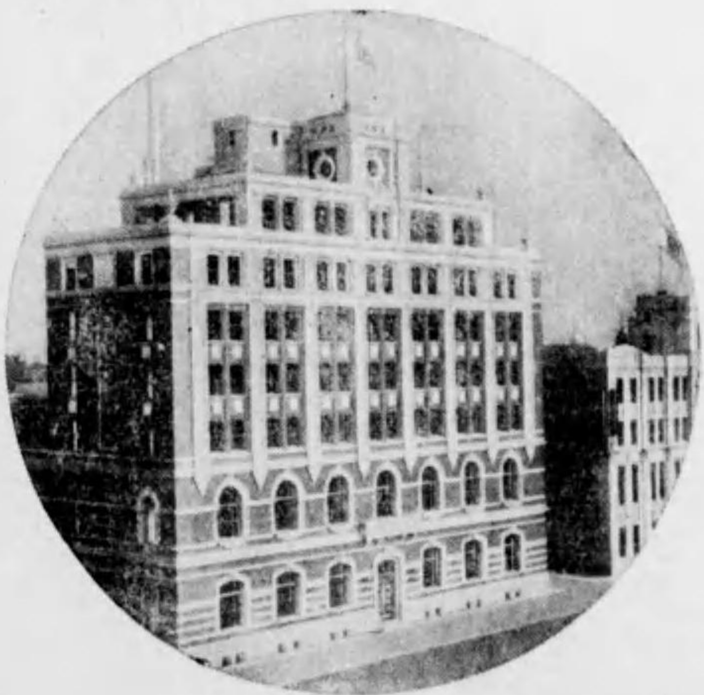
目丁四橋今區東市阪大