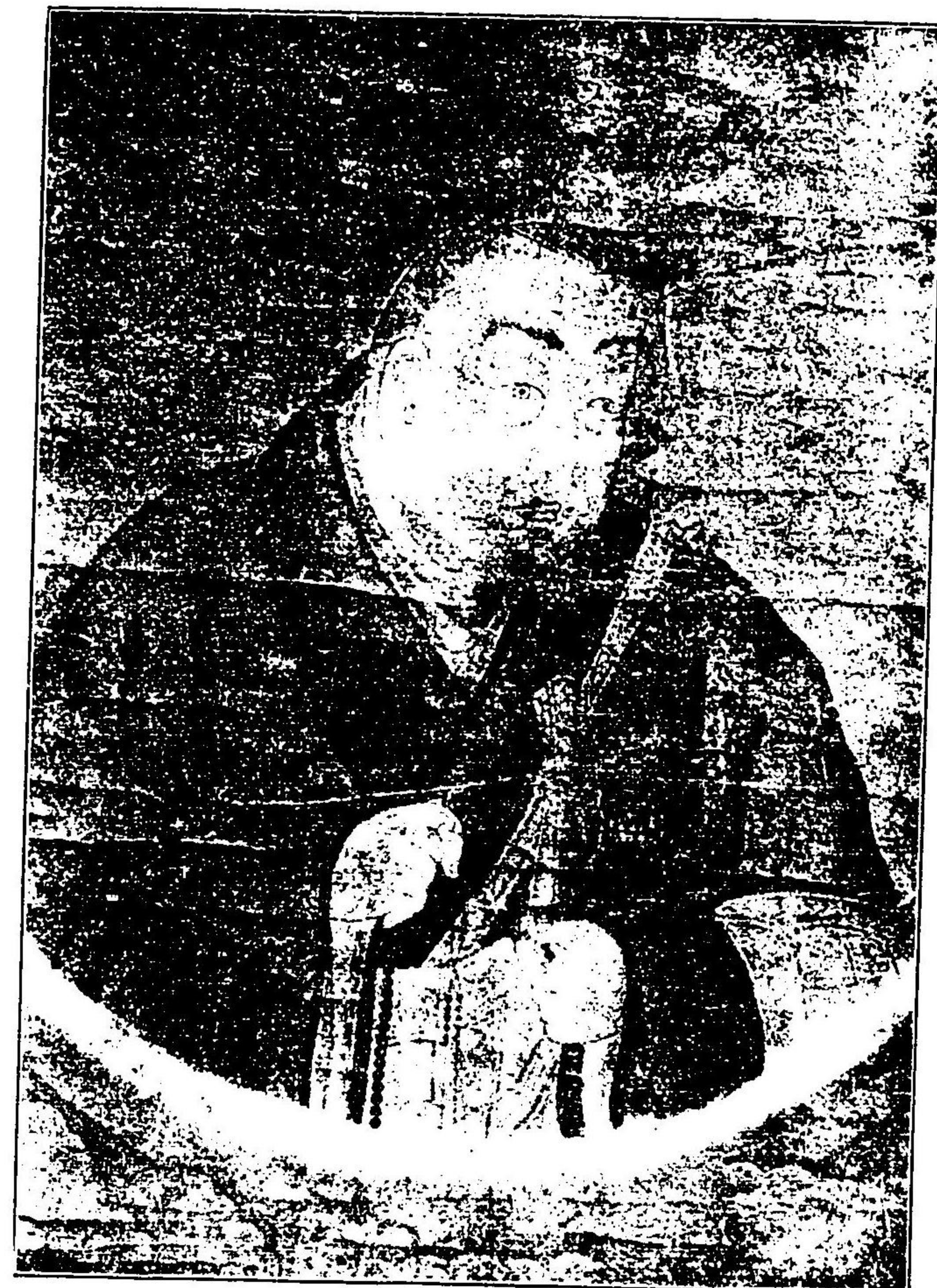
法然上人眞影 陀摩法眼證寶筆 (京都知恩院所藏)