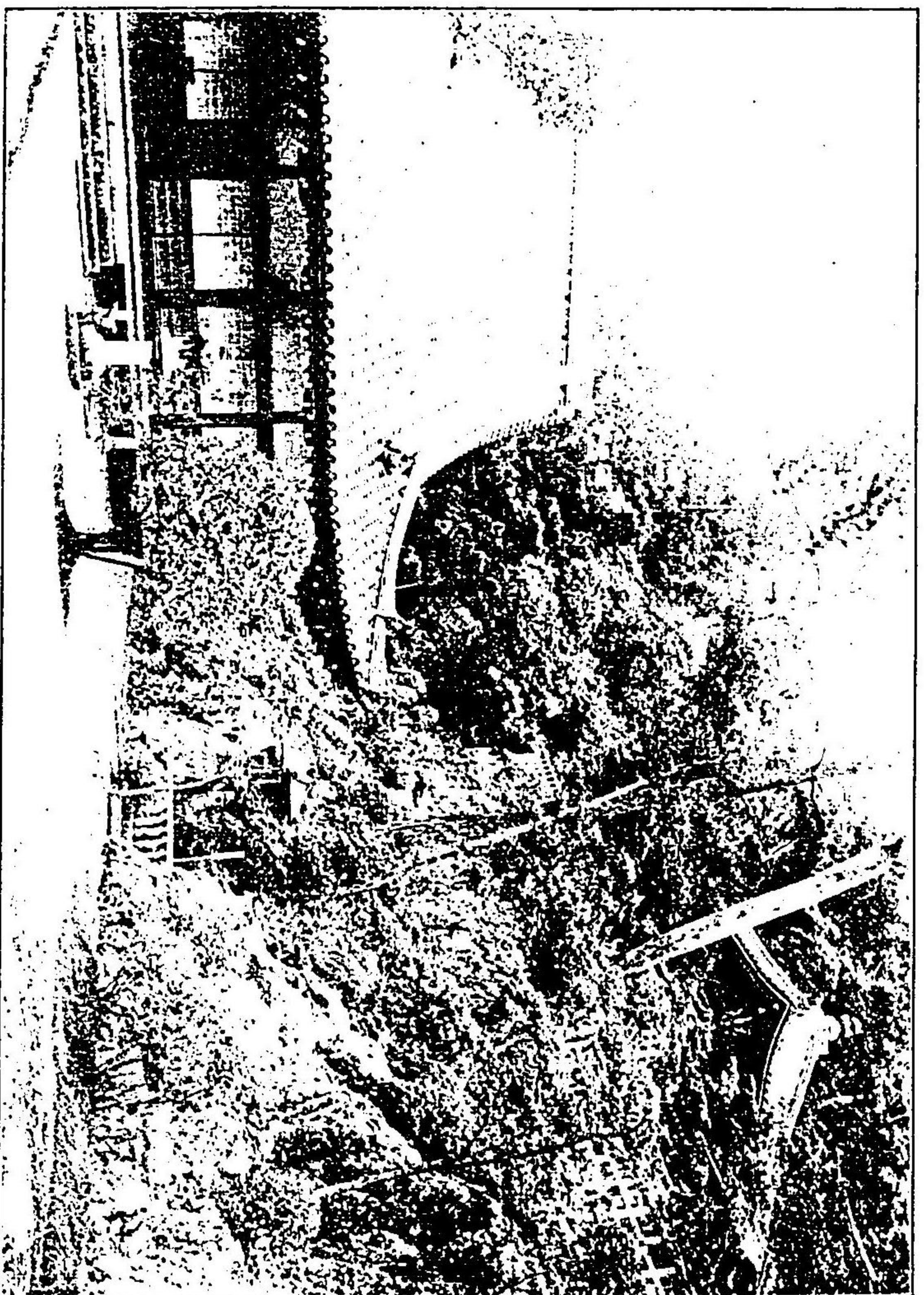
廟本八上然法 (山東都京在)