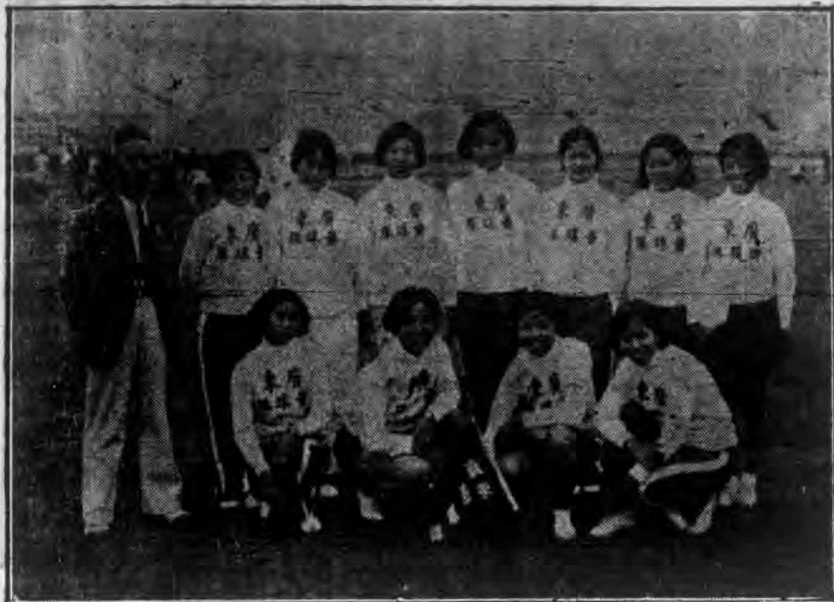
隊東廣之軍亞球排球壘子女獲